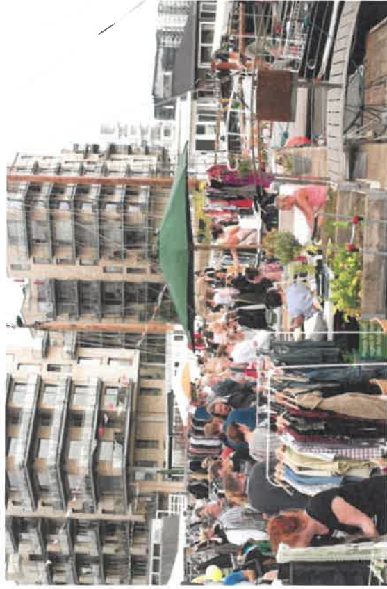
Skibbroen I baggrunden Københavns Roklub & HC Ørstedsværket