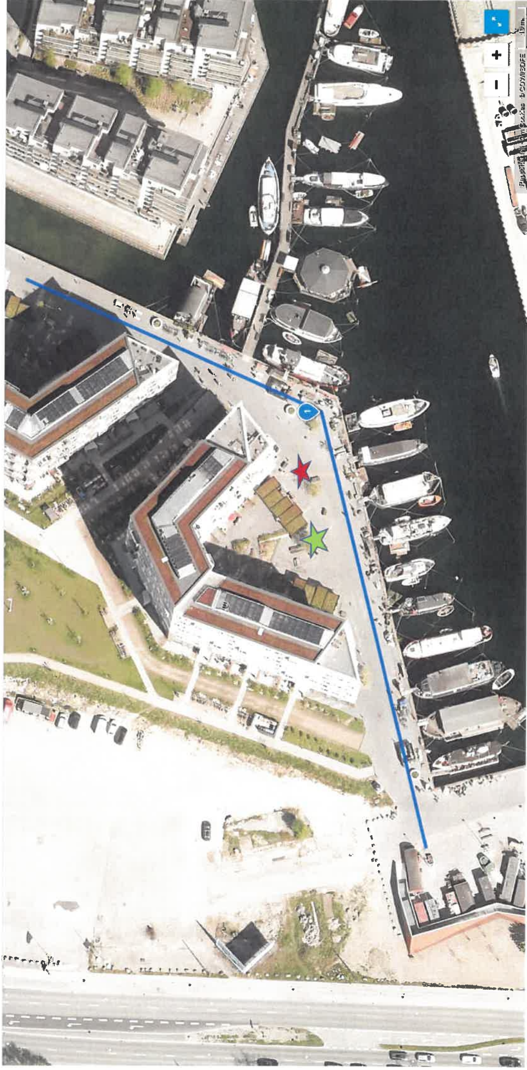
Skibbroen mulige placeringer: Grøn stjerne og rød stjerne