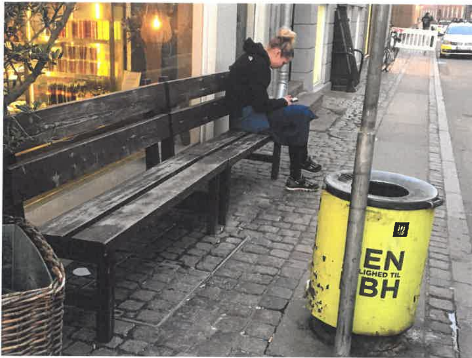
CPH Hostel Vandkunsten, Ikke 1.5 meter fodgænger passage