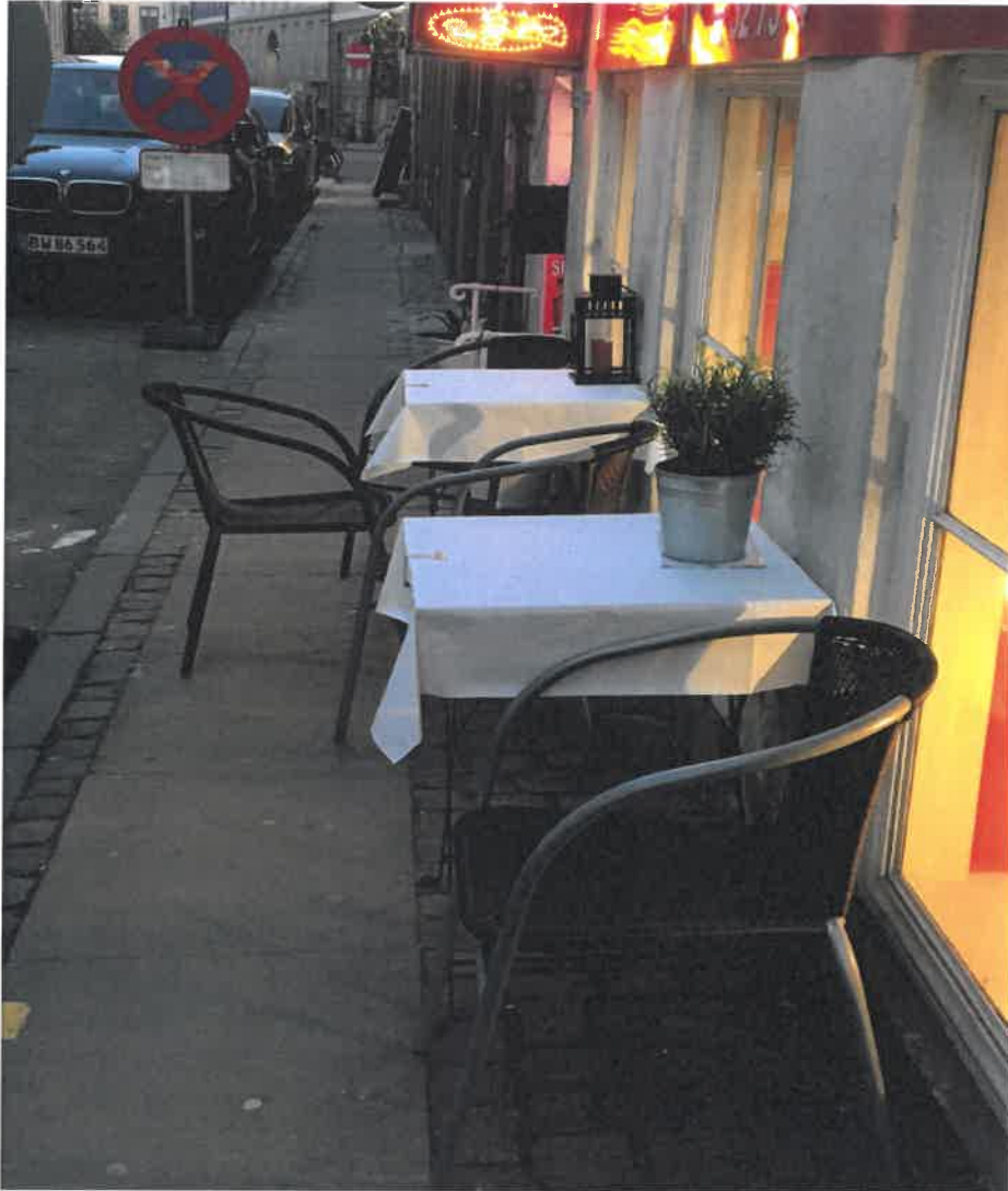
----- Coffe Industry Krystalgade. Ikke 1,5 m fodgænger passage