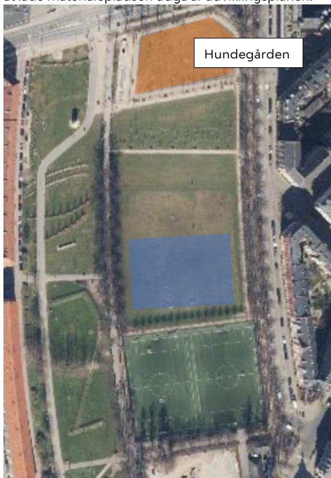
Figur 2- Nørrebroparken, luftfoto 2020, med markeret projektområde, blå. Længst mod nord er hundegården placeret med orange markering.

Det kan oplyses, at Teknik- og Miljøforvaltningen har en forventning om at lade materialepladsen udgå af udviklingsplanen.