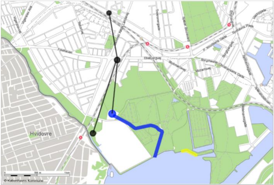
Figur 3. Den oprindelige løsning (blå streg) og forslaget hvor skybrudstunnelen forlænges til Damhus Å (sort streg). Renseanlæggets område er det hvide areal under den oprindelige løsning.