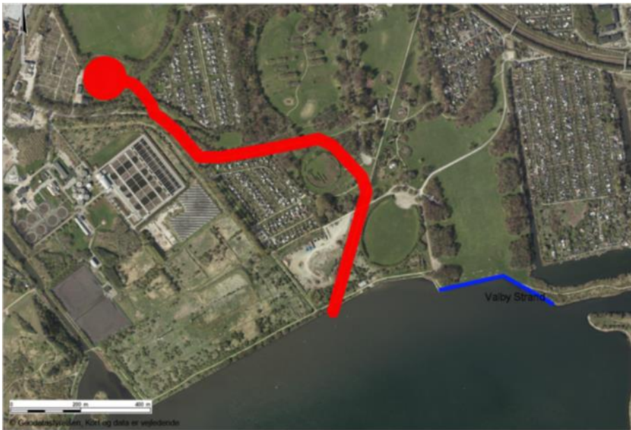
Figur 1. Den røde streg viser forslaget fra den oprindelige skybruds-konkretisering. Bredden på den røde streg angiver cirka bredden på skybrudsløsningen.

udvidelsen af tunnelprojektet svarer til de estimerede omkostninger for overfladeprojektet. Der bliver således ikke forøgede omkostninger som følge af skiftet i løsningstype. Det skal bemærkes, at beregningen af omkostningerne for begge projekter er foretaget i den indledende projektfase, hvorfor der kan forekomme mindre variationer i omkostningerne i forhold til fremtidige beregninger. Der mangler flere forundersøgelser før den endelige beslutning kan foretages. Medfører forundersøgelserne, at prisen bliver væsentlig dyrere, vil et nyt forslag blive udarbejdet.