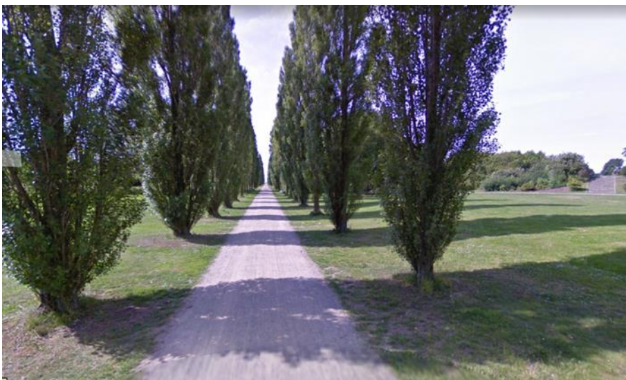
Figur 2. Grusstien i poppelalléen er cirka 3 m bred. Kanalen vil strække sig cirka 9 m på hver side af grusstien i en meters dybde.