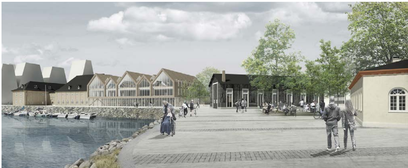
Visualisering, der viser en pladsdannelse for enden af Trangraven. Lystøndeskuret er omdannet til en aktiv facade, og den nye bebyggelse ved Kuglegaarden danner front mod kanalrummet