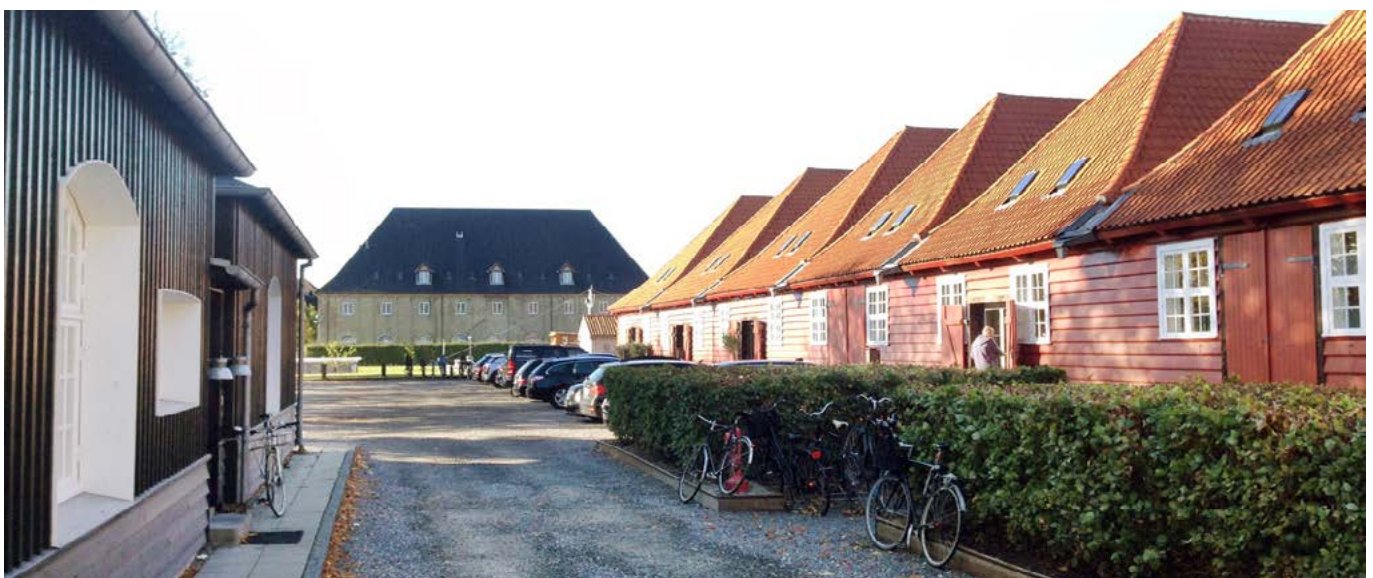
Billede fra Galionsvej med masteskurene til højre i billedet og Kuglegaardens nordlige fløj i baggrunden

Overgangen fra Christianshavn til Holmen er tydelig og fortæller om hver sin meget forskellige tankegang om bybygning. På den ene side forsvarsbyen med dens indbyggede logik og på den anden side Handelsbyens med dens logik. Overgangen er markeret med de to vagthuse ved Værftsbroen, hvorefter Arsenaløen træder frem. Holme og kanaler og åbne kig, lav bebyggelse og grønne strukturer er dominerende træk. Bebyggelsesplanen følger gademønsteret, og kan virke ret enkel, men er mere kompleks med en sammensætning af markante store murede bygninger som sammen med lave og farverige træbygninger og træer skaber et mere rummeligt spændende byområde.