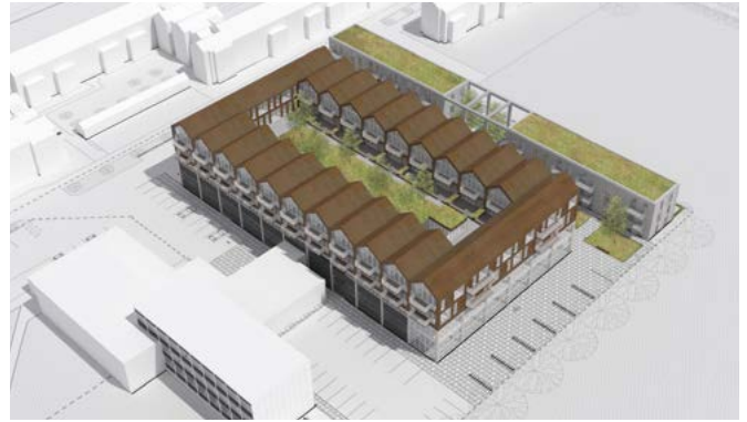
Ny bebyggelse ved Basecamp. Tilbygning på den eksisterende hal, og rækkehuse på grundens østlige side, hvor der nu er garager.

grønne bytræk. Der er ruter langs kanalerne, og de åbne grønne græsletter bibeholdes og udvides ved Basecamp. De eksisterende beplantninger langs facader videreføres ved nybygninger, ligesom beplantningen suppleres med større træer enten byplan-traditionen tro, som enkeltstående solitære træer, i grupper eller plantet som alléer. Denne grønne del udbygges med en langt større artsrigdom og med en større biodiversitet til følge.