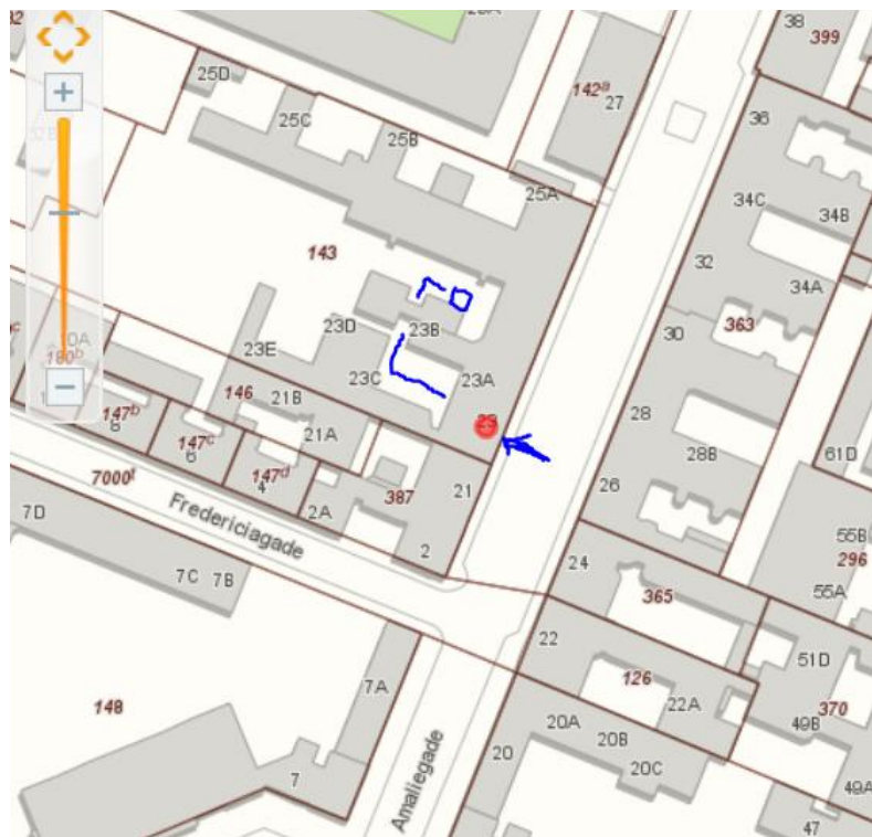
Figur 1 Affaldsskur i bagerste gård

Det eksisterende affaldsskur i den bagerste gård (se figur 1) er ikke stort nok til at rumme alle beholderne, og skal derfor udvides, hvis denne skal anvendes til den fremtidige affaldshåndtering. Hvis skuret bygges uden tag, kræves der ikke en byggetilladelse. Hvis der skal være tag på, kræver det en byggetilladelse, som forudsætter en forudgående tilladelse fra Slots- og Kulturstyrelsen.