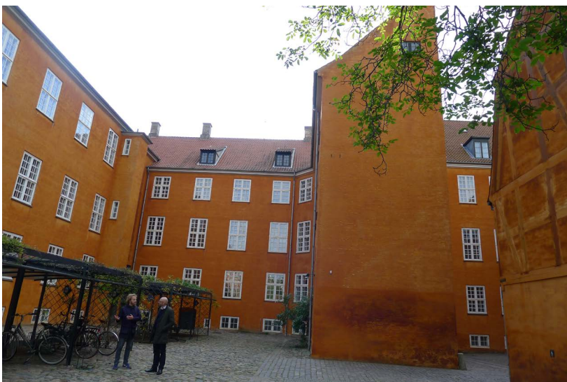
Amaliegade 23-25; Mellembygning, Gårdfacade og gavl af sidehus