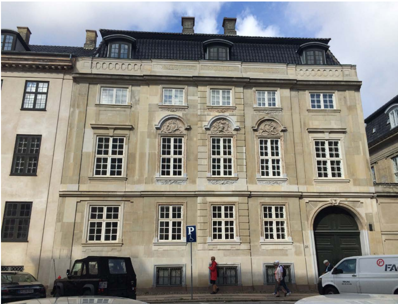
Amaliegade 23-25; Nr. 25, Gadefacade