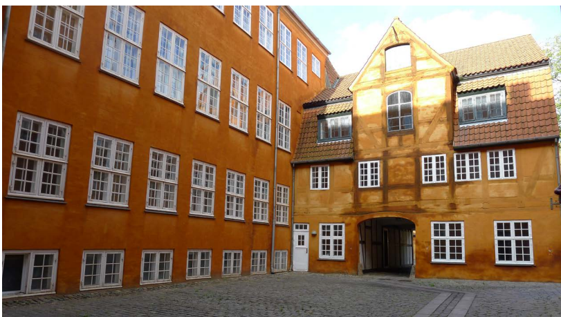
Amaliegade 23-25; Nr. 23, Sidehus 1 og Baghus 1