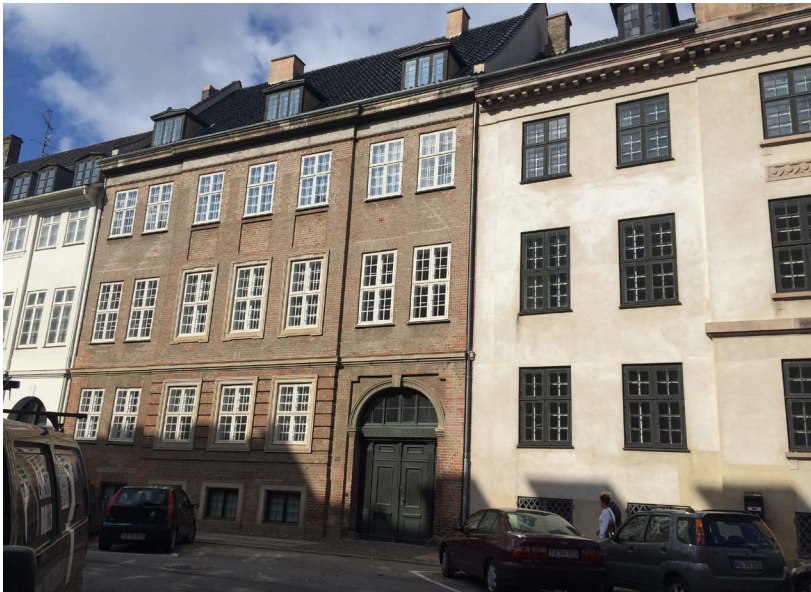
Amaliegade 23-25; Nr. 23 Gedefacade