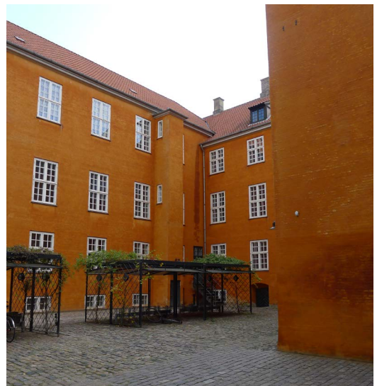
Amaliegade 23-25; Nr. 25, Sidehus 1 og Gårdfacaden på forhus