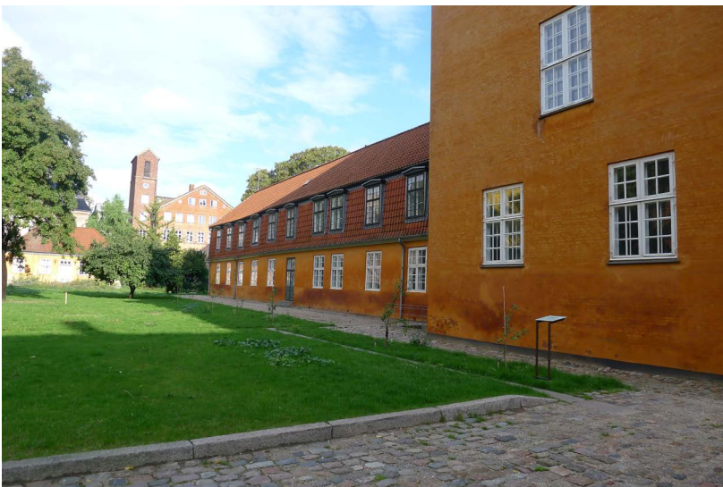
Amaliegade 23-25; Nr. 25, Sidehus 1, Sidehus 2 og Mansard sidehus