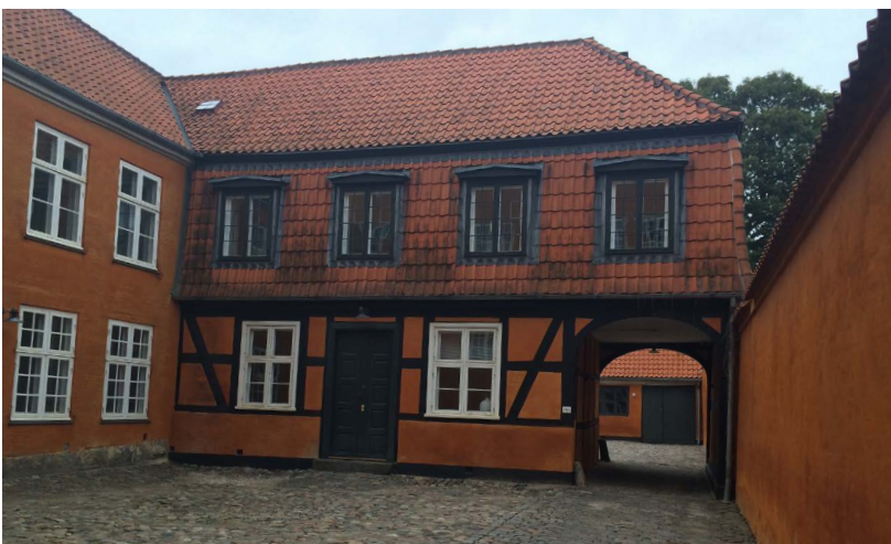
Amaliegade 23-25; Nr. 25, Mansard Tværhus