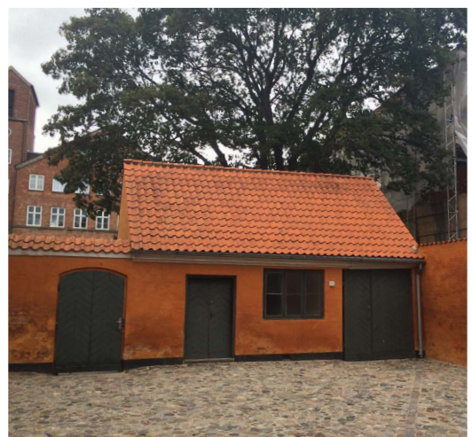
Amaliegade 23-25; Nr. 25, Baghus fra 1918