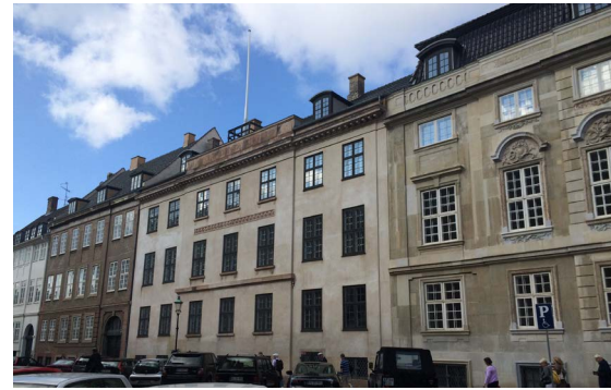
Amaliegade 23-25; Mellembygning, Gedefacade