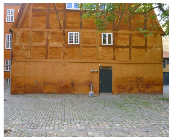
Amaliegade 23-25; Nr. 23, Baghus 1, Gavl