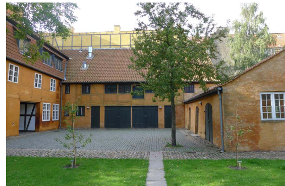
Amaliegade 23-25; Nr. 23, Baghus 1, Sidehus 2 og Baghus 2