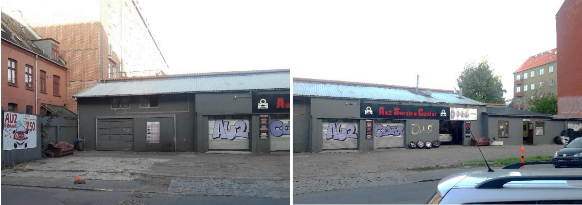
Provstevej 1-3 (E)