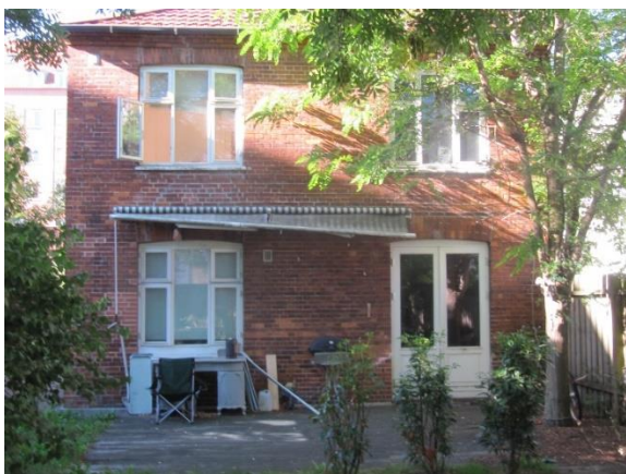
Theklavej 37 (C)