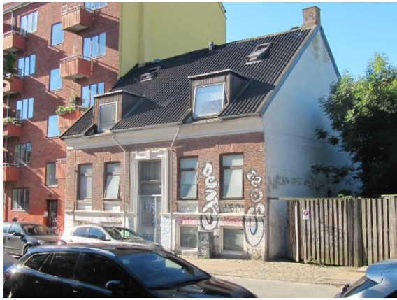
Theklavej 33 (A)