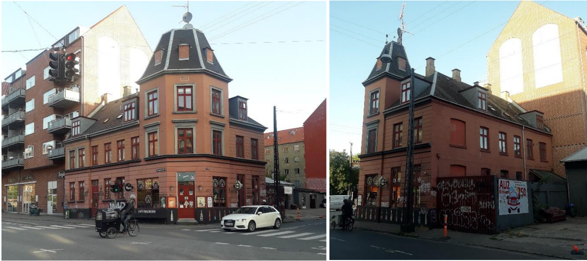
Frederikssundsvej 70 (D)