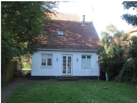
Theklavej 35 (B)