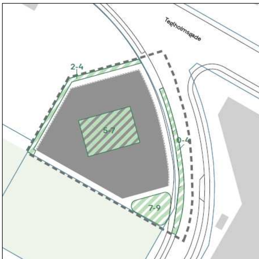
Figur 2 – "Tegning 6c Træer" i lokalplanen

vandedninger. HOFOR ønsker ikke, at der placeres træer her, da indtrængende rødder fra de nye træer kan skade forsyningsledninger og dermed kraftigt nedsætte ledningernes levetid og udfordre forsyningsikkerheden. På denne baggrund ønsker HOFOR, at man ikke anlægger træer oven på ledningen, således at forbrugerne friholdes for takststigninger som følge af reparation af ledninger pga. indtrængende rødder.