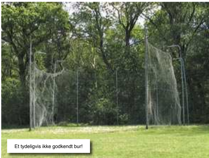
Et tydeligvis ikke godkendt bur!