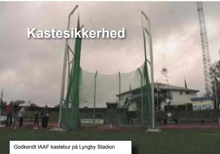
Godkendt IAAF kastebur på Lyngby Stadion

Sikkerhed ved kasteøvelser har i mange år ikke altid haft den opmærksomhed som den burde, og mange farlige situationer er opstået, uden at de har fået den store opmærksomhed. Desværre har der igennem tiderne også været nogle alvorlige ulykker! Vi er nogle, der i mange år har debatteret dette emne, og med baggrund i et par uheldige situationer i 2004 samt det forhold, at IAAF har skærpet kravene til hammer- og diskosanlæg, har DAF bedt os om at udarbejde en "sikkerhedshvidbog". Et lille opslagsværk, hvor klubber, stadions og aktive kan finde viden om regler, ansvar og adfærd ved såvel stævner som træning.