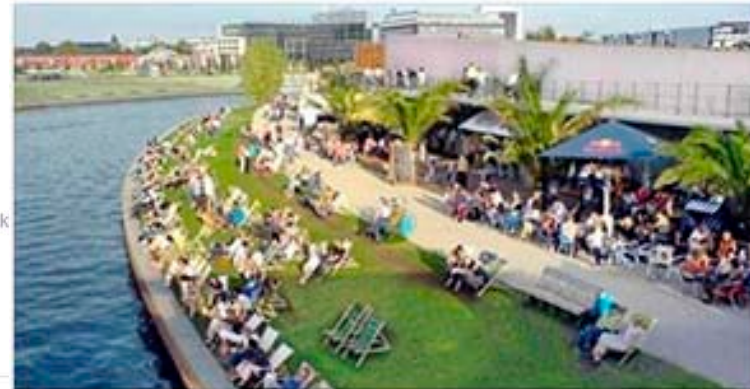
Idekonkurrence for Christiansholm / Papiroen

Hvordan kunne du tænke dig, at en ny kultur- eller fritidsfunktion på Christiansholm kommer til at se ud? Skal du have sand under fødderne og et pulserende byrum som ved strandbaren i Berlin? Eller måske en stor offentlig badeanstalt? Eller noget helt tredje? Deltag idekonkurrencen i linket via fanbladet "Deltag".