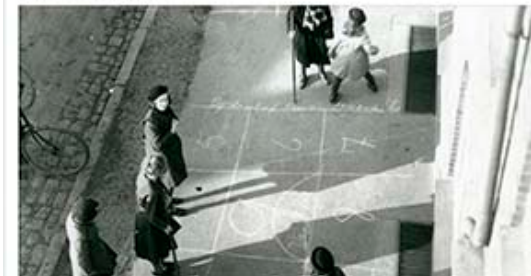
Åbning af Børnenes by – Københavns Museum

I dag den 25. marts kl 16. åbner Københavns Museum sin nye udstilling, Børnenes by. En udstilling om børns fællesskaber i storbyen historisk og i dag. Kom og vær med - der er både børnevenlige drinks og performance med AndyOp. Og så kan du møde børnene, der fortæller om deres udstillede genstande.