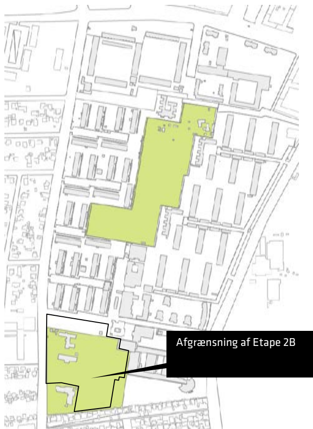
Areal for udviklingsplanens etape 2Bs disponering i dag