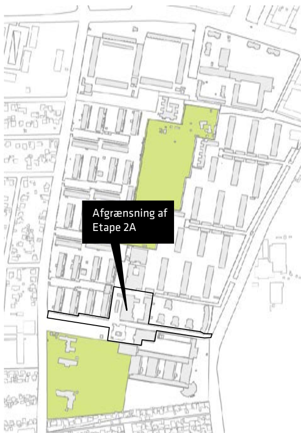
Areal for udviklingsplanens etape 2As disponering i dag