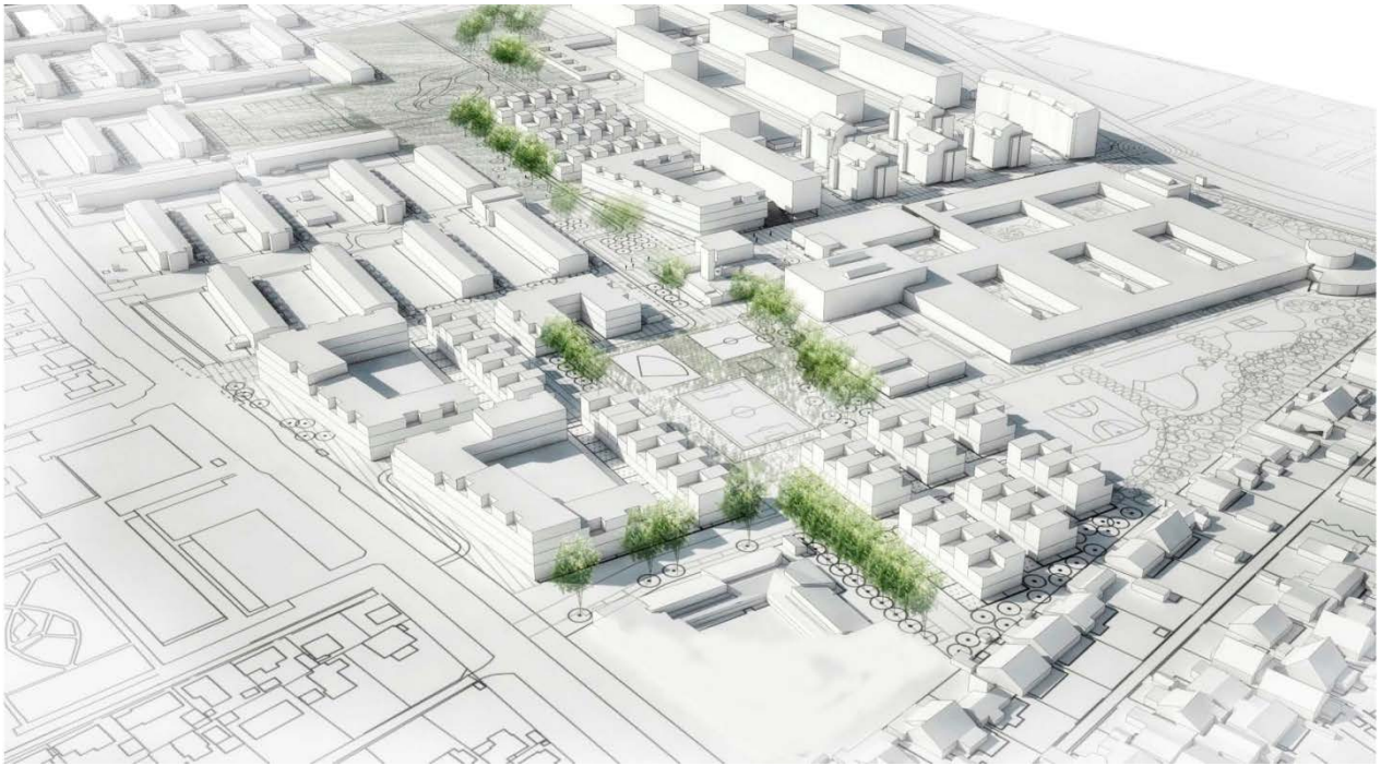
Illustration af potentielt nybyggeri i Urbanplanen