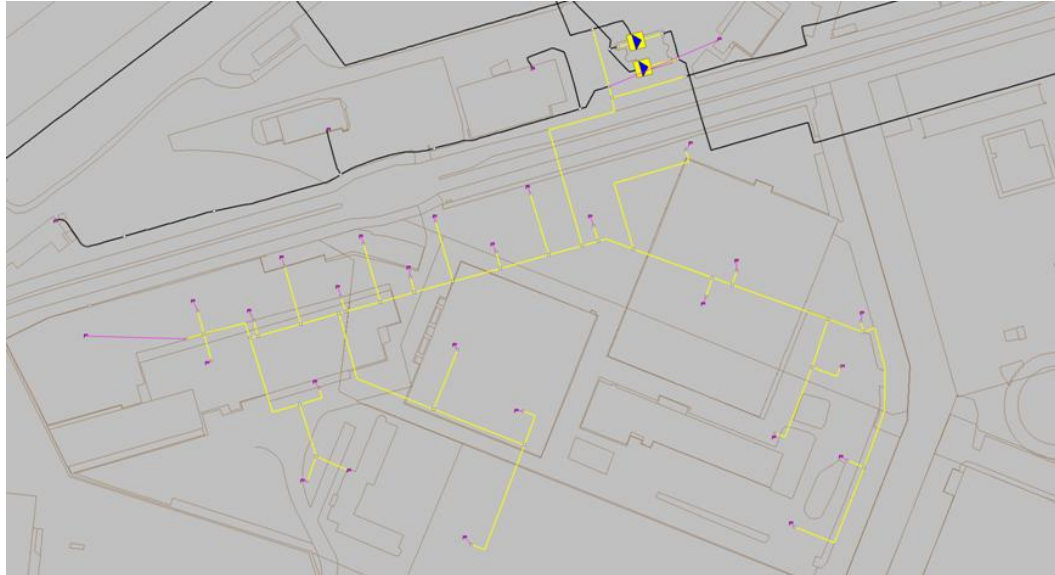
Figur 3 Udbygget ledningsnet for Frederiks Brygge

placering bliver endelige. Ud over gadeledningen skal der etableres stikledninger ind til hver bygning.