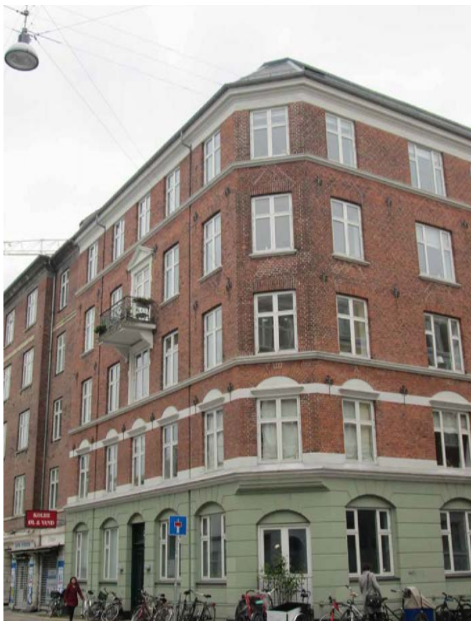
Facade mod Broagergade og Haderslevsgade