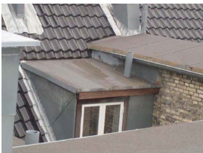
Kvist mod gård