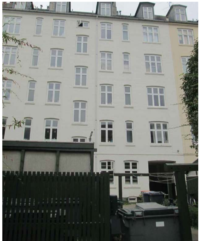
Facade mod gård