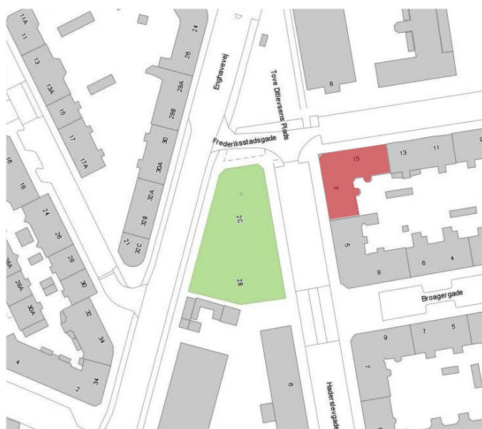
Ejendommen ligger i bydelen Vesterbro / Kgs. Enghave