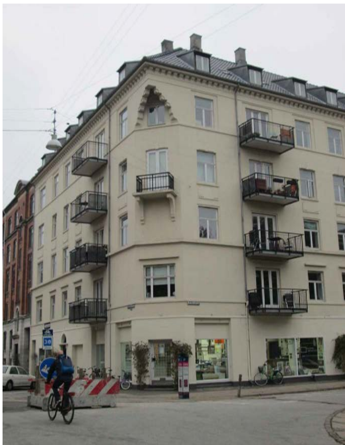
Facade mod Haderslevgade og Frederiksstadgade