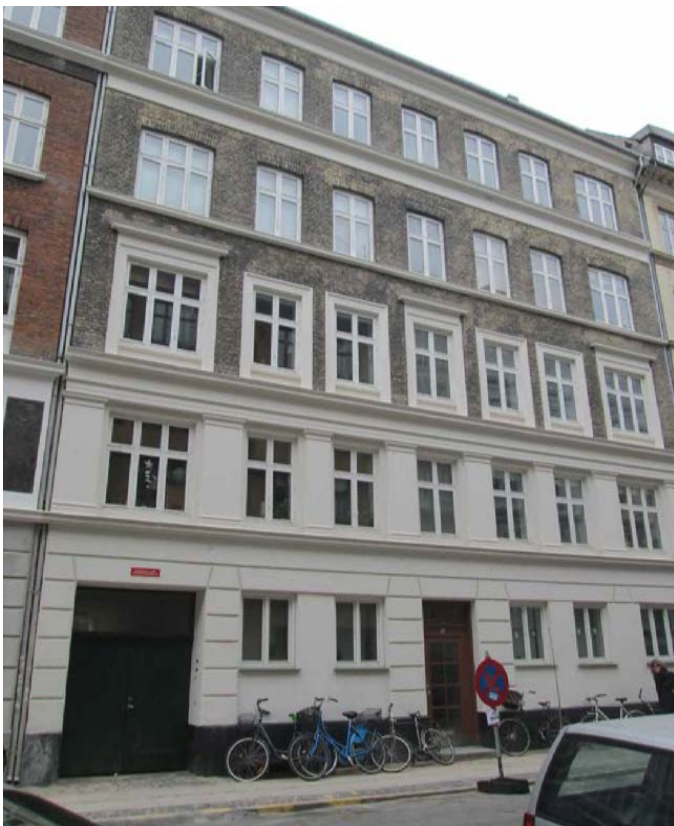
Facade mod Oehlenschlägersgade