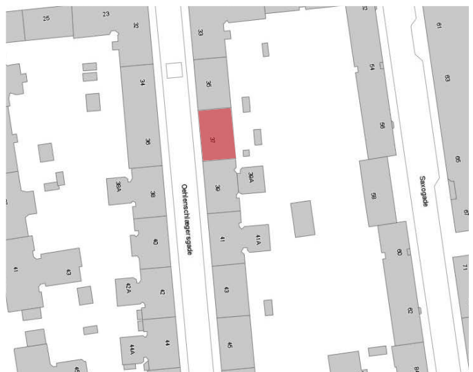
Ejendommen ligger i bydelen Vesterbro / Kgs. Enghave