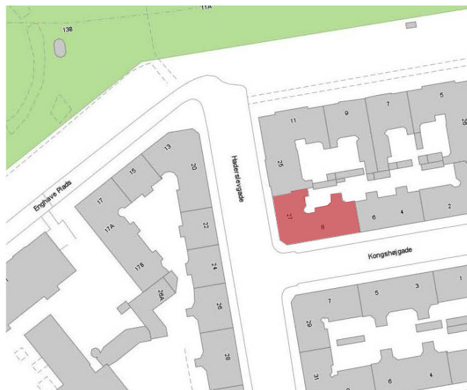
Ejendommen ligger i bydelen Vesterbro / Kgs. Enghave