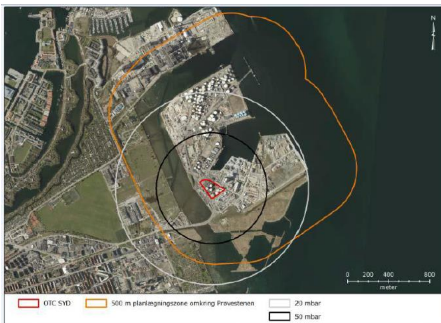
Figur 3. Afstand til 50 mbar og 20 mbar trykkurver (er figur 6-11 i miljøkonsekvensrapporten)

Risikoanalyser viser, at denne hændelse – uheld med eksplosion i gassky - er en meget usandsynlig hændelse, som vil forekomme mindre end 1 gang for hver milliard år, 1 \cdot 10^{-9} . Hvis Kløverparken ønskes ændret fra nuværende erhverv til mere følsom anvendelse, vil Københavns Kommune foretage en nærmere vurdering af om den ønskede fremtidige anvendelse er overensstemmende med nærheden til Prøvestenen. Der vil indenfor 50 mbar zonen som udgangspunkt være behov for at fastsætte krav til sikring af vinduer mod trykpåvirkning samt til personbelastninger, afhængigt af hvorledes området indenfor 50 mbar zonen ønskes anvendt.