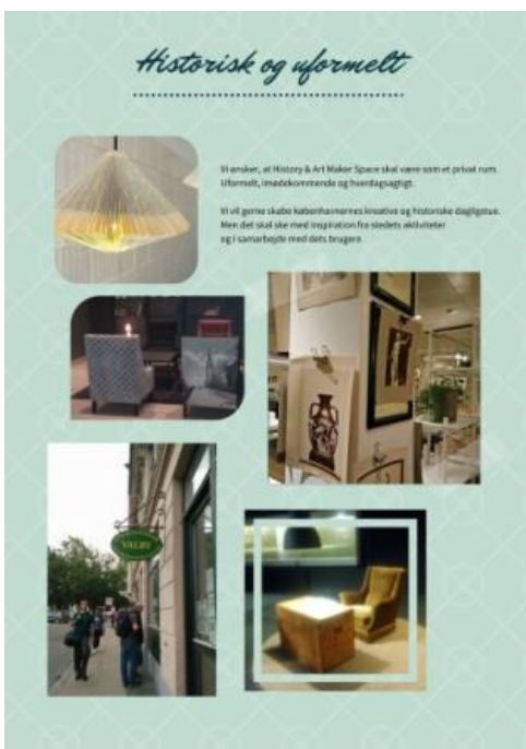
Et historisk og uformelt Maker Space.

Der skabes et dynamisk læringsmiljø, hvor de besøgende bliver aktive remixere af historien, samtidig med at institutionernes samlinger udforskes på nye kreative måder. Byens gæster og borgere får et sted, hvor de kan gå på opdagelse i deres egen historie og bruge den til at skabe ny værdi. Det er med til at give museer og arkiv et menneskeligt ansigt, som gør kunsten og kulturarven lettere tilgængelig for de brugere, som ikke normalt går på museer.