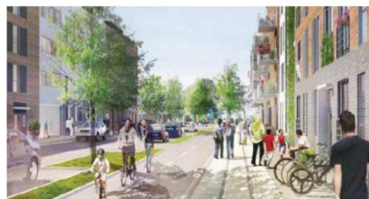
Fremtidig boliggade hvor facadeforløbet fremstår meget varieret for at nedbryde den ensartede bebyggelse og skabe bedre proportioner.