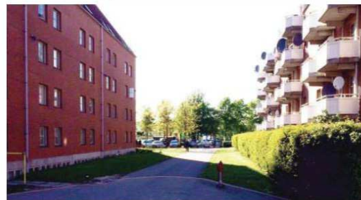
Eksisterende brandvej som omdannes til boliggade.