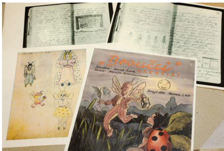
Illustrationer og dagbogsoptegnelser fra Theresienstadt

Vi forestiller os en aftenforestilling med billet salg for andre interesserede - der ville kunne dække nogle af udgifterne i forbindelsen med turen til København.