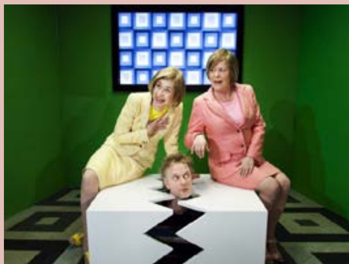
Platons Hule, Teater Hund, 2014.