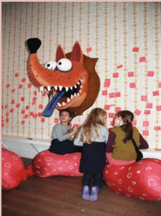
Rune T Kidde, Storm P Museet, 2015.