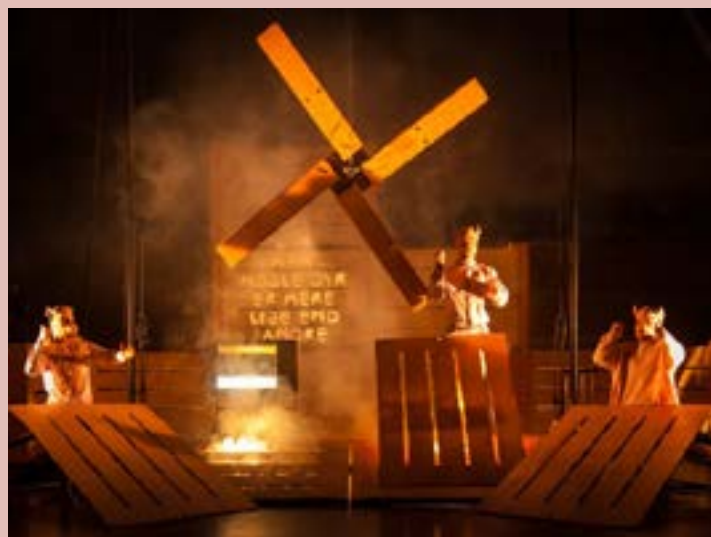
Animal Farm, Cikaros Zebu, 2012.