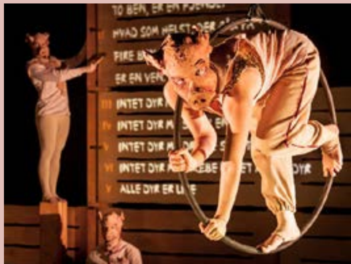
Animal farm, Cikaros Zebu, 2012.