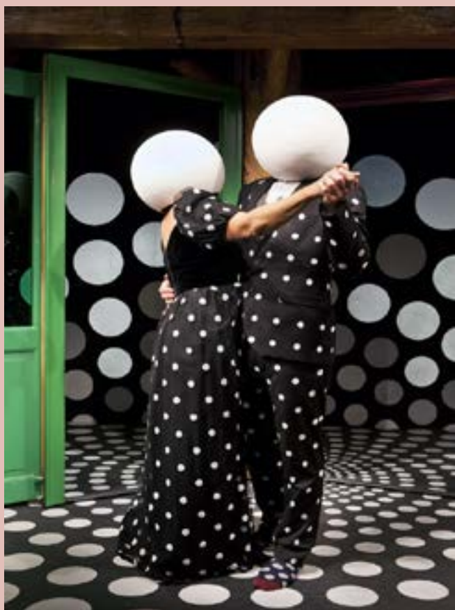
Dav Du Der, Det Lille Teater, 2014.