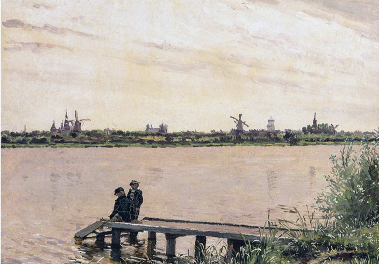
Udsigt til København set fra Sortedamsdosseringen ca. 1837. Maleri: Christen Købke/Ordrupgaard

og byggerirøveri, men en vældig indånding af frihed og fællesskab. Aum!