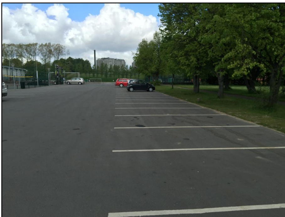
Billedet viser et antal ledige pladser på det nordlige område på en hverdag kl. 10.

Der findes ingen tællinger for området omkring centeret, hvilket bør tilvejebringes, som første led i en videre proces.