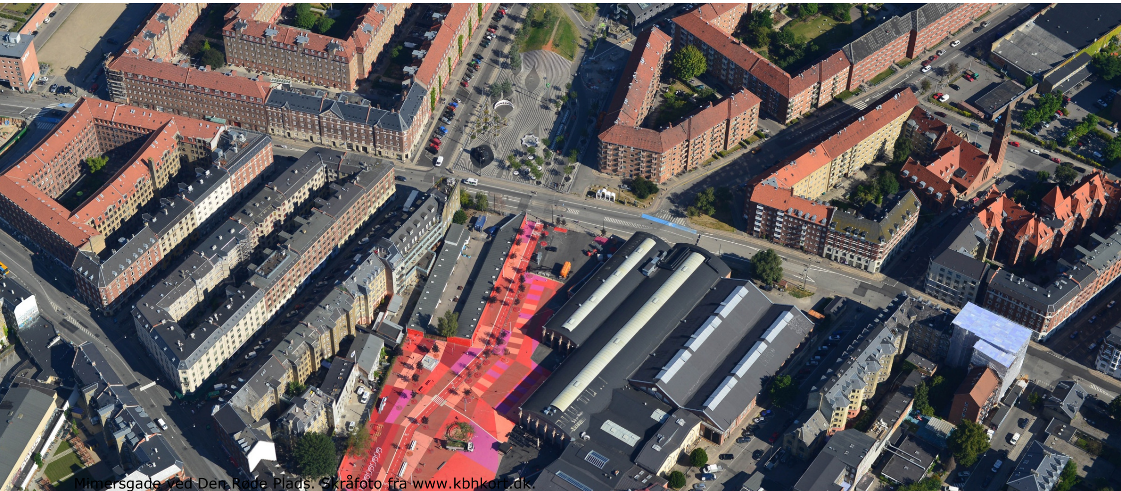
Mimersgade ved Den Røde Plads.