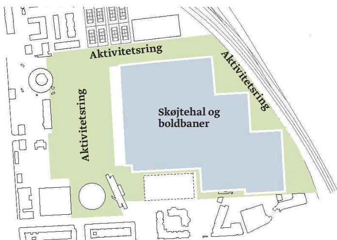
Scenarie 1 - Park- og Aktivitetsområde med indpasning af en skøjtehal, baseret på lokaludvalgets forslag, der er vist t.h.