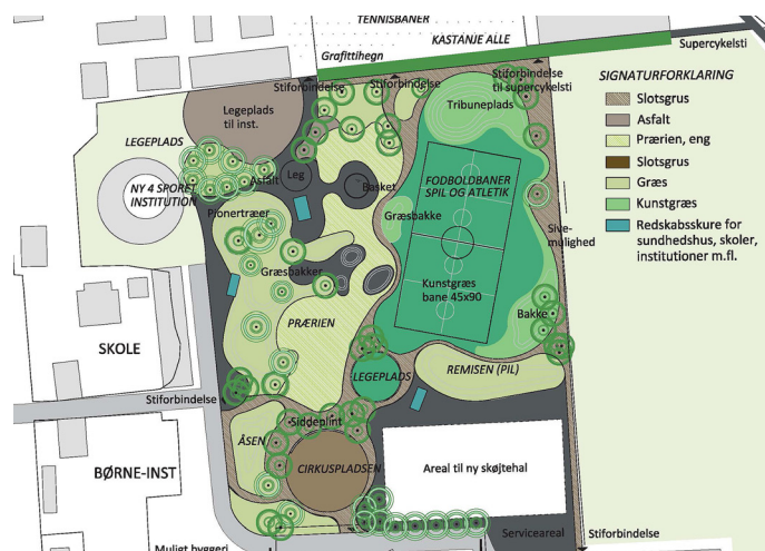
Østerbro Lokaludvalgs forslag til disponering af området