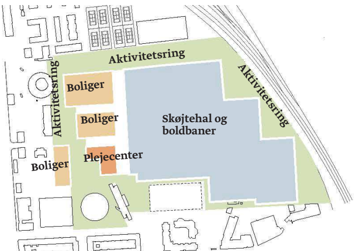
Scenarie 3 - Park- og aktivitetsring med indpasning af en skøjtehal, 30.000 m 2 boliger i 6-7 etager og 9.000 m 2 plejecenter - se ill. ovenfor og t.h.