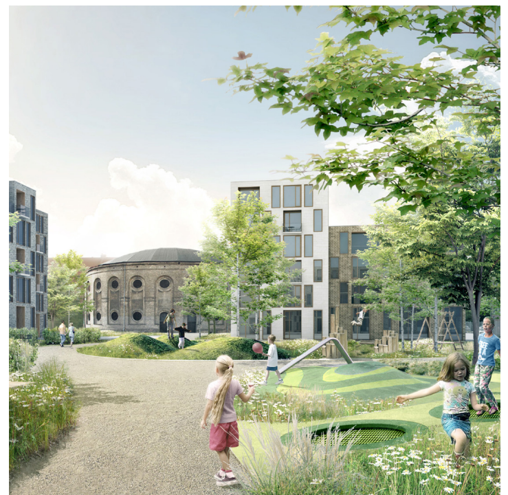
Illustration af park- og aktivitetsringen med den grønne kile mellem boliger, plejecenter og med Gasværksteatret i baggrunden