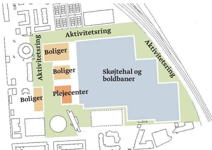
Scenarie 2 - Park- og aktivitetsring med indpasning af en skøjtehal, 15.000 m 2 boliger i 4-5 etager og 9.000 m 2 plejecenter - se ill. t.h. og nedenfor