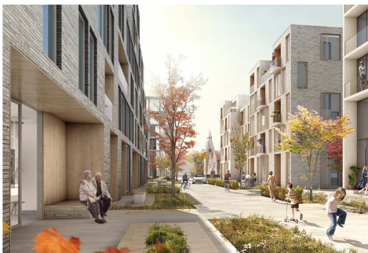
Illustration, der viser intern boliggade i scenarie 2 og 3, her indrettet som lege- og opholdsgade