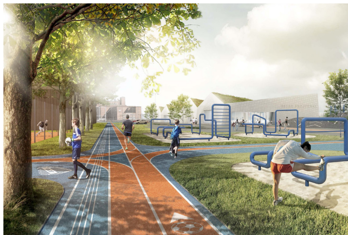
Illustration af park- og aktivitetsringen her fitness allé langs den nordlige afgrænsning af området. Denne del af aktivitetsringen er i princippet ens i alle tre scenarier