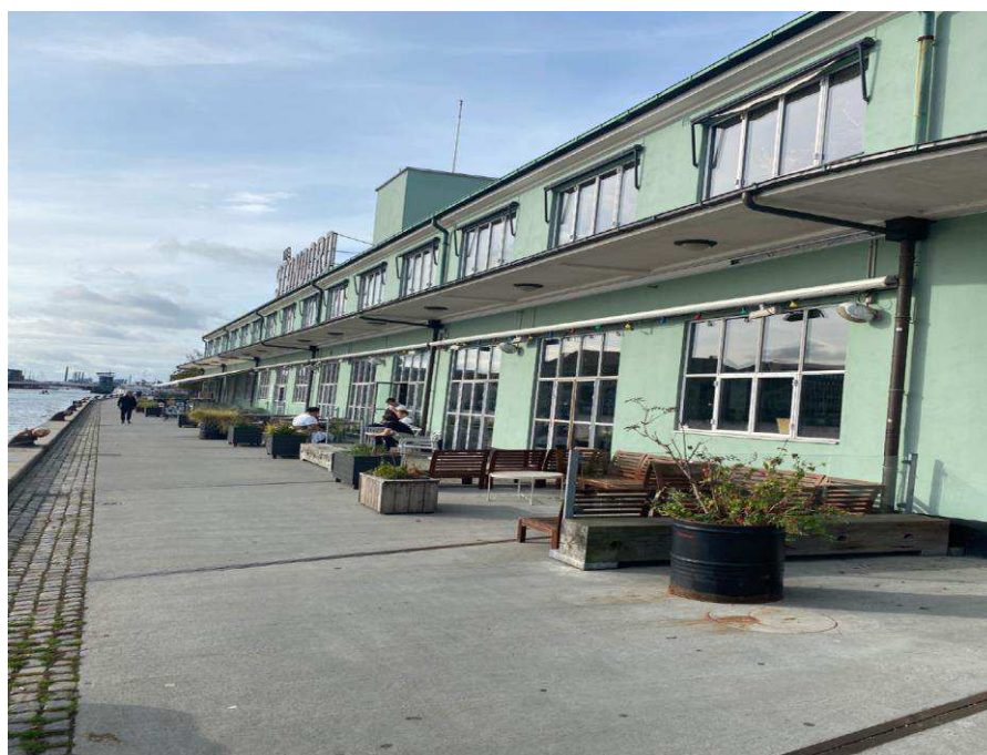
Opstilling der tidligere er givet tilladelse til