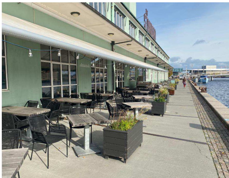
Opstilling der tidligere er givet tilladelse til