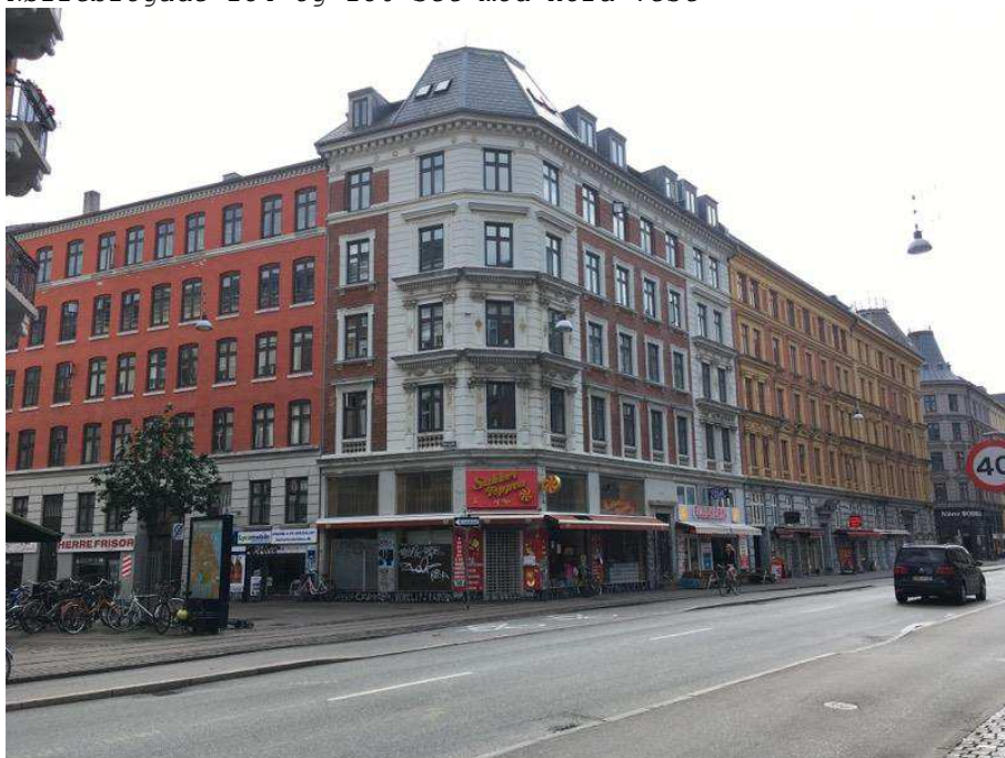
Nørrebrogade 158/Thorsgade 2-4 set mod øst.