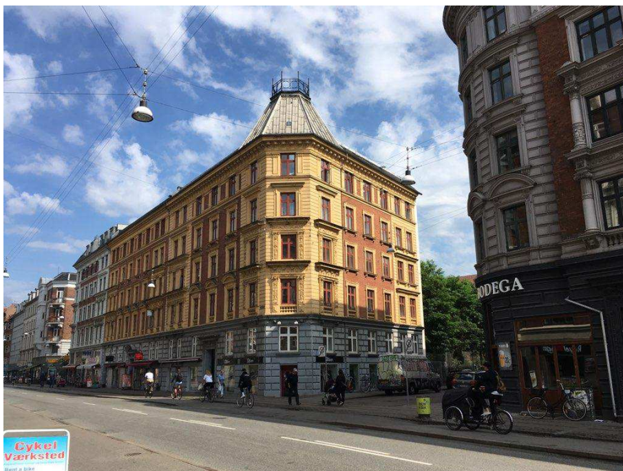
Nørrebrogade 154 og 156 set mod nord-vest

grad af udsmykning, som er en bærende del af bygningernes udtryk.