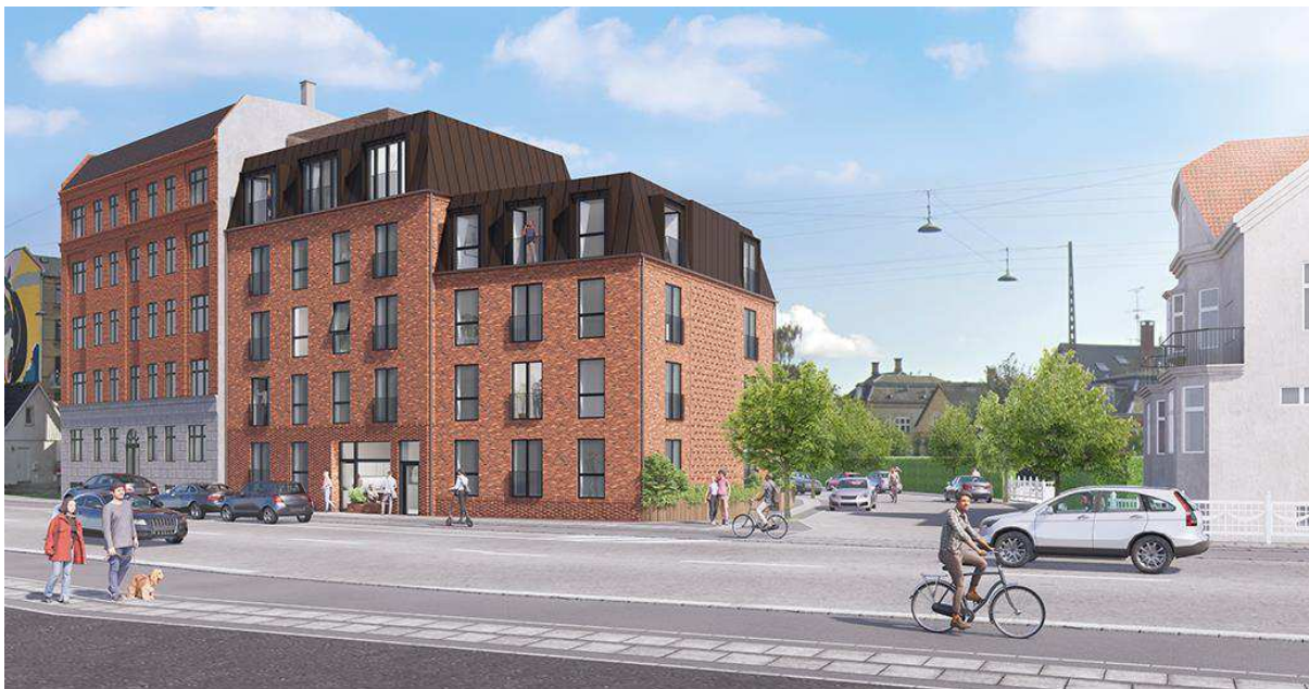
Visualisering, der viser et eksempel på et nybyggeri i overensstemmelse med lokalplanen ud mod Engelsvej og Søren Norbys Allé. Illustration: Lantz Arkitekter.