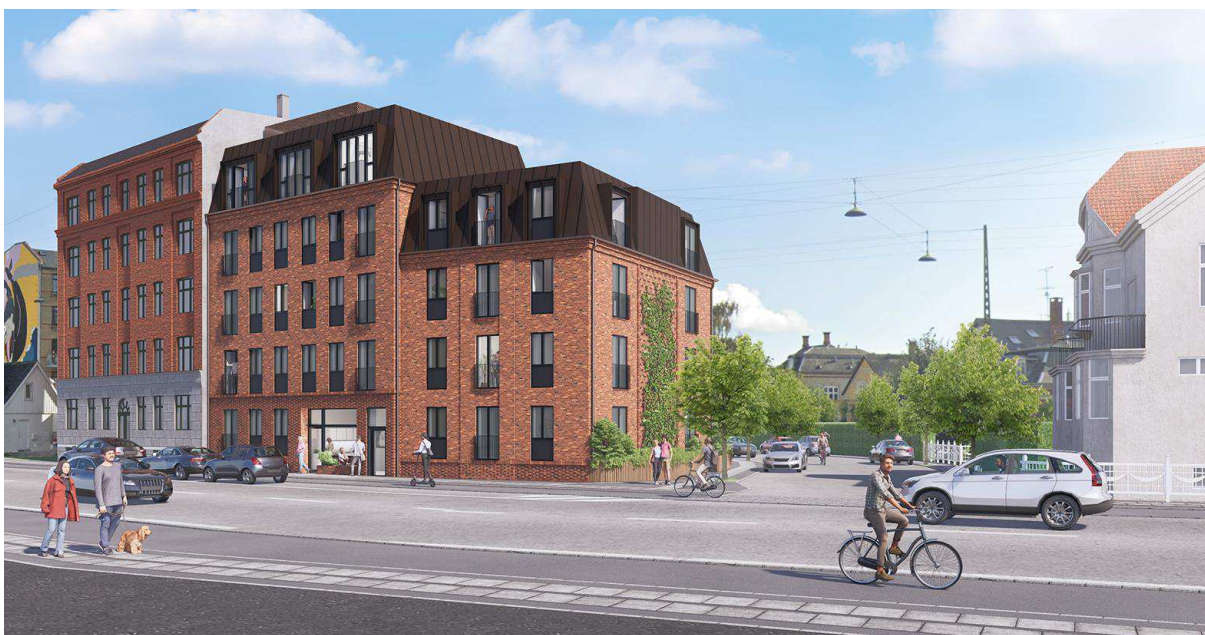
Visualisering, der viser et eksempel på et nybyggeri i overensstemmelse med lokalplanen ud mod Engelsvej og Søren Norbys Allé. Illustration: Lantz Arkitekter.