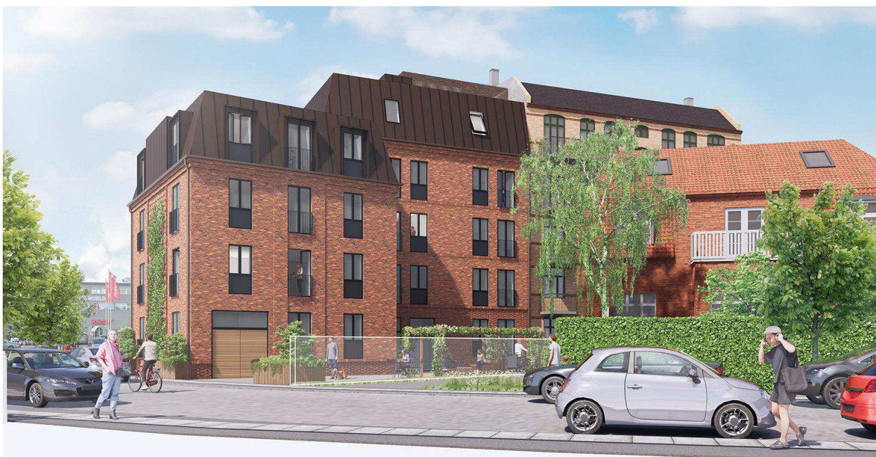
Visualisering, der viser et eksempel på et nybyggeri på Engelsvej 25 i overensstemmelse med lokalplanen set fra Søren Norbys Allé. Illustration: Lantz Arkitekter.