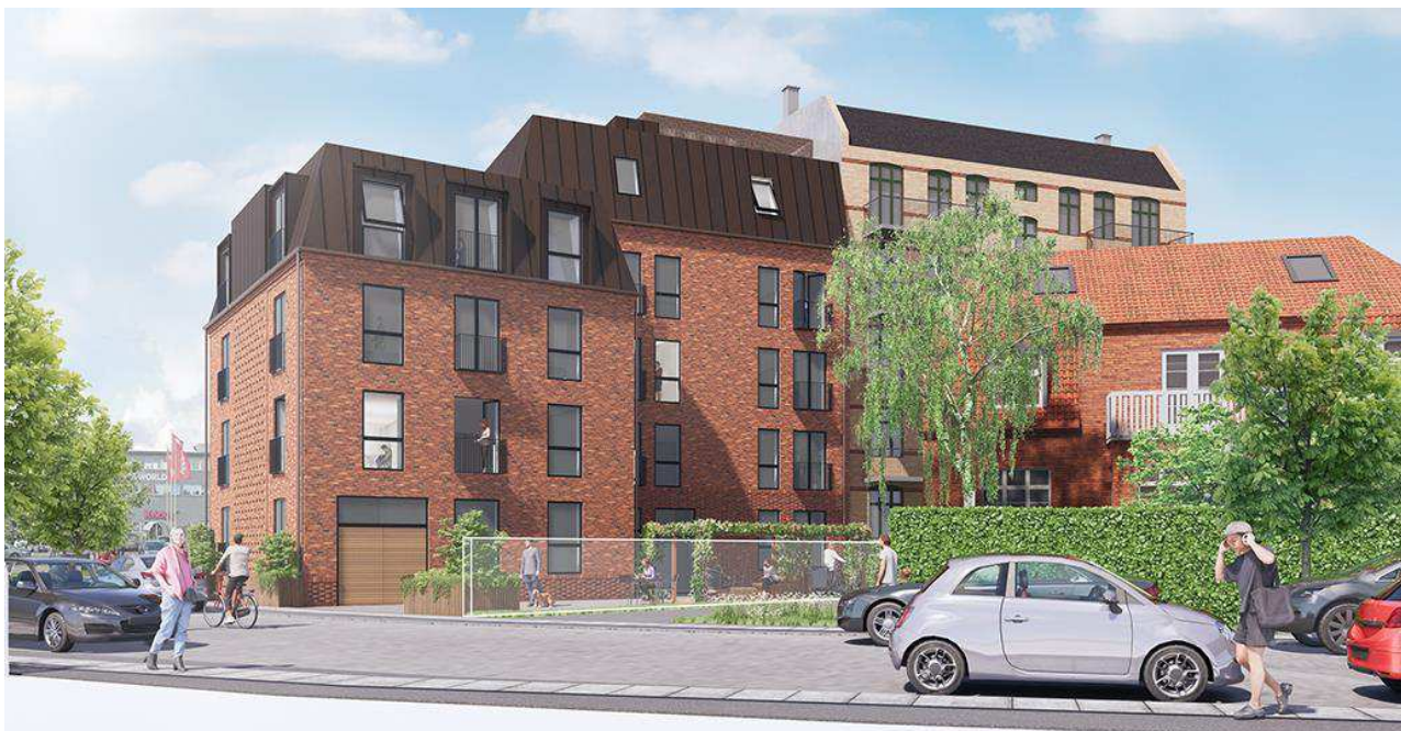
Visualisering, der viser et eksempel på et nybyggeri på Engelsvej 25 i overensstemmelse med lokalplanen set fra Søren Norbys Allé. Illustration: Lantz Arkitekter.