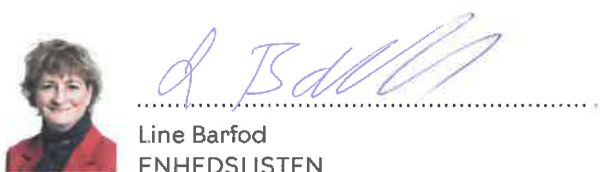
Line Barfod ENHEDSLISTEN