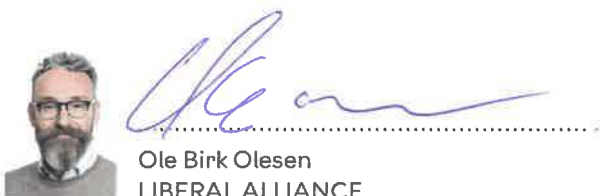
Ole Birk Olesen LIBERAL ALLIANCE