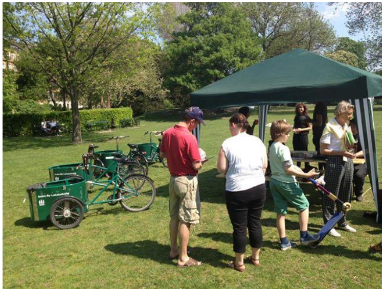
Miljøpunktet foretog partikelmåling i forbindelse med Park Life eventen den 18. maj 2013. I 2014 skal målingerne centreres omkring Nørreport og Torvegade

I 2025 forventes der at være 100.000 flere Københavnerne og hermed også en større andel af Københavnerne som transporterer sig til og fra hjem/arbejde til og fra indre by og Christianshavn. I dag sker en for stor del af denne transport i bil, ligesom en stor del af erhvervstransporten sker i forurenende lastbiler. Det er en udvikling, som der skal gøres noget ved. Miljøpunktet vil fortsat fokusere på alternative til privatbilismen og erhvervskørslen i lastbil og sætte fokus på den forurening Københavnerne dagligt udsættes for pga. sundhedsskadelige partikler fra transporten. De indsamlede data kan efterfølgende bruges af LU i en dialog med kommunen om luftforurening. I 2014 vil Miljøpunktet have fokus på testkørsel for erhvervsdrivende og familier.