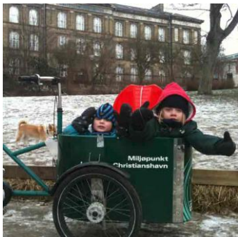
Miljøpunktets publikation om borgere der bruger ladcykel selvom de har bil.