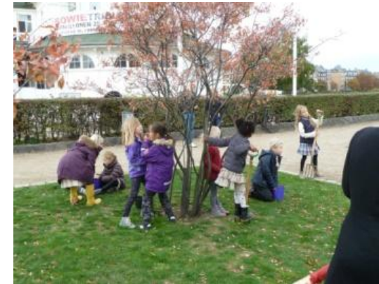
Børn fra børnehaver i indre by planter blomsterløg v. Lad Sørner Blomstre