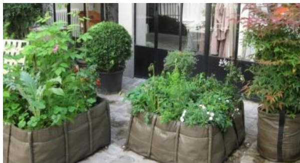
Miljøpunktet opsatte i 2013 planteposerne bacsac