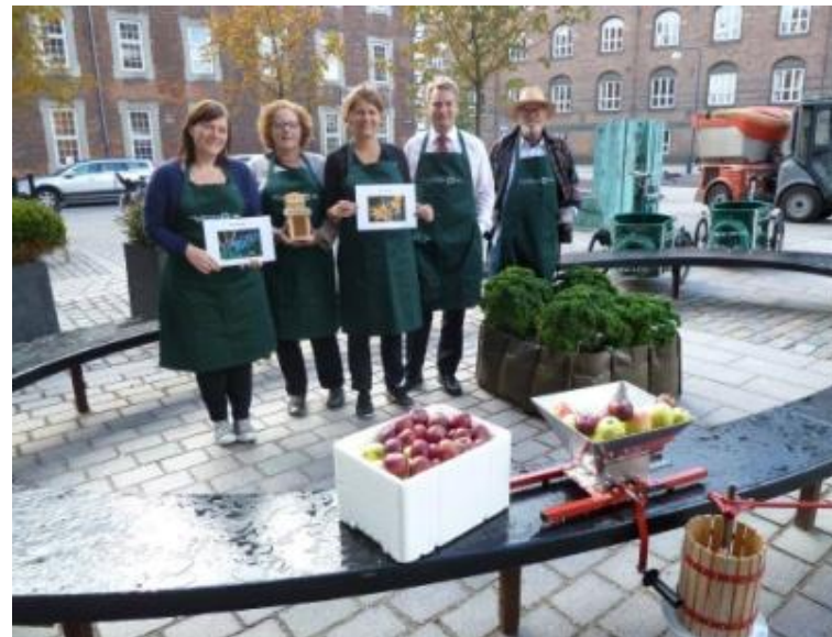
Miljøpunktet gør klar til Kulturnatten (oktober 2013)

Der holdes løbende koordineringsmøder mellem Lokaludvalg, Københavns kommune og Miljøpunkterne. Projekterne er hovedsagligt beregnet på at blive udført af frivillig arbejdskraft, suppleret med faglig kompetence under igangsætning, tilretning efter et evt. pilotprojekt og studenterhjælp, samt faglig hjælp til den kommunikative skriveproces til sidst. Miljøpunktets projekter skal være lokalt forankrede og netværksskabende. Miljøpunktets opgave er at stå til rådighed med faglig kompetence til gennemførelse af aktiviteter og projekter.