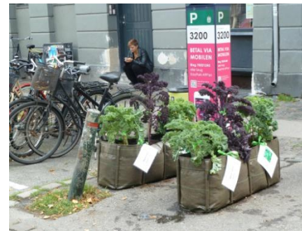
Et lille åndehul er opstået