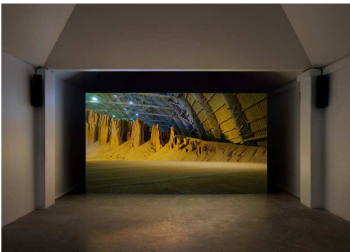
AMOUNT November 19, 2022 – January 15, 2023