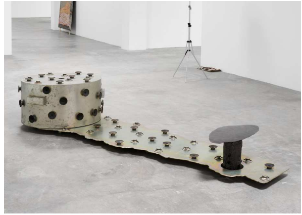
Torben Ebbesen, Between Yes and No August 26 – October 8, 2022