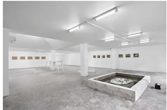
Marina Pinsky, Undertow August 28 – October 16, 2021