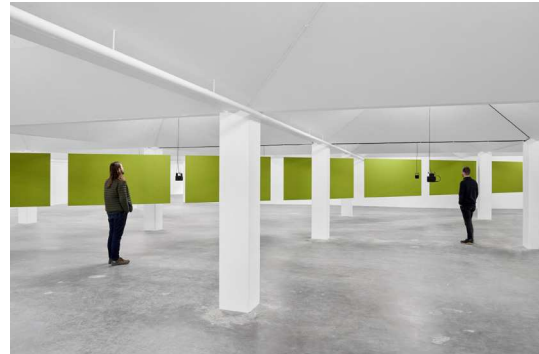
Florian Hecker, Formulations As Texture, horizontal and vertical crossings February 12 – April 2, 2022