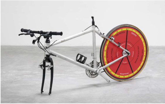
Some of the Hole September 5 – October 17, 2020