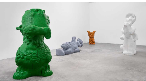
Mads Lindberg, Sculpture 3D February 12 – April 2, 2022