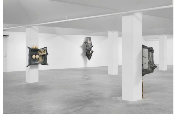
Piotr Łakomy, Vessel November 14, 2020 – January 16, 2021