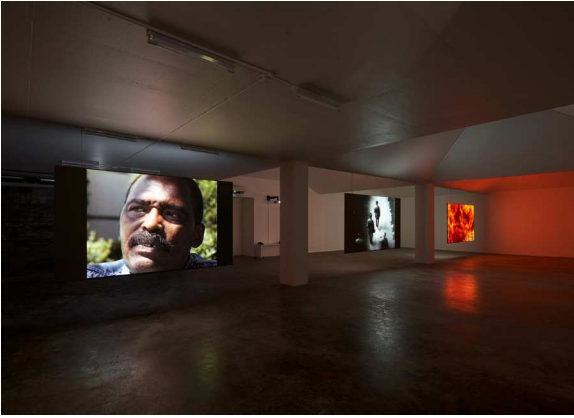
Lynn Hershman Leeson, The Electronic Diaries (1984-2019) May 13 – June 25, 2022