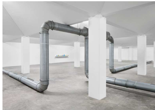
Ghislaine Leung, Fountains February 25 – April 16, 2023