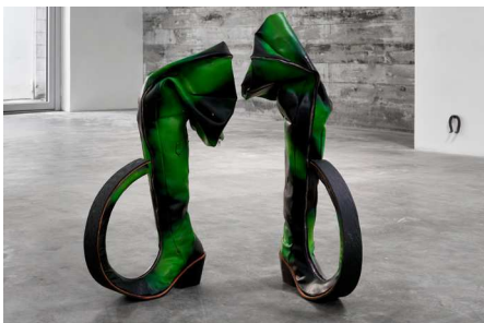
CRY ME A RIVER August 26 – October 15, 2023