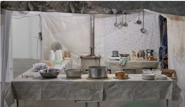
Signa, The Market May 29 – July 3, 2021