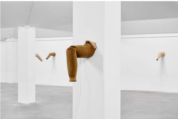
Berenice Olmedo, Eccéite November 13, 2021 – January 8, 2022