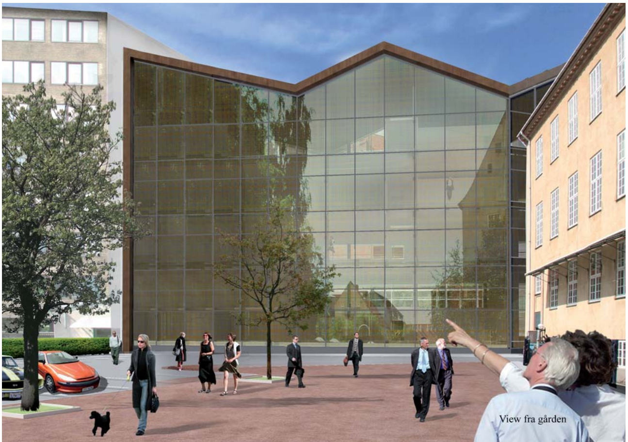
Nybyggeriet set fra gården.