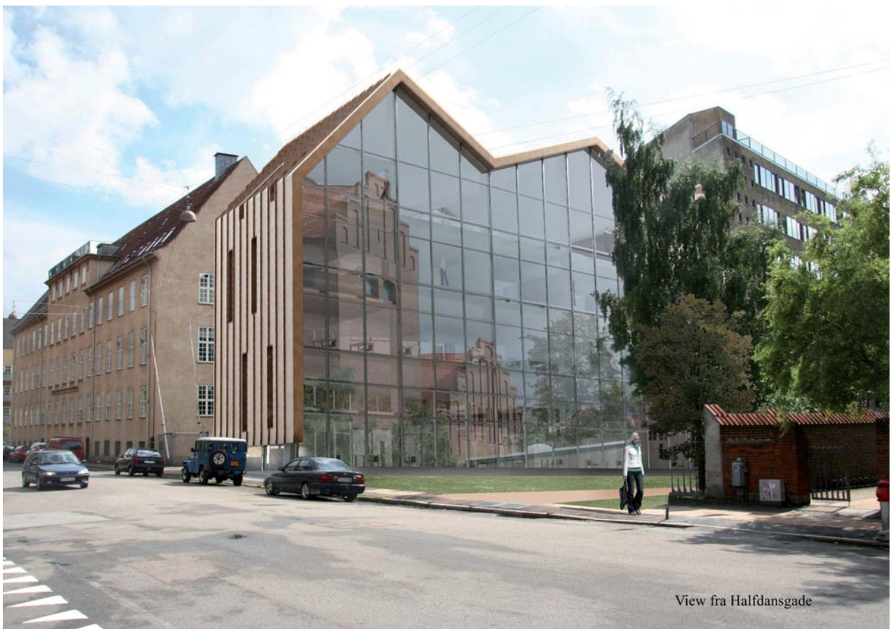
Nybyggeriet set fra Halfdangsgade. Til højre den i lokalplanen fastlagte sti ind mod kirken.