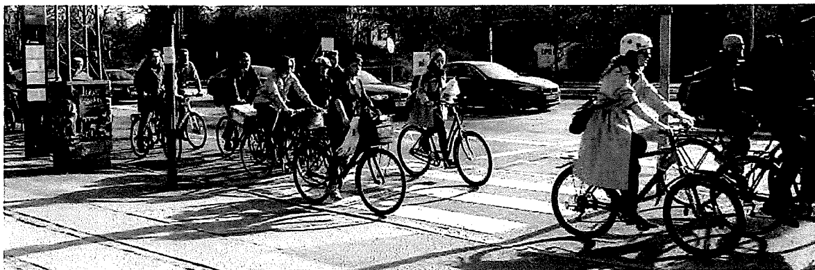
Indre By Lokaludvalg