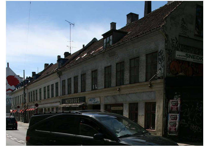
Enghavevej 10-14, (3)