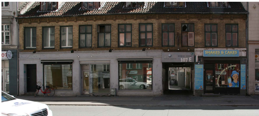
Vesterbrogade 107 C, (4) Privat bygherre