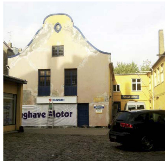
Hollænderhuset i gården, Enghavevej 16, (3) Privat bygherre