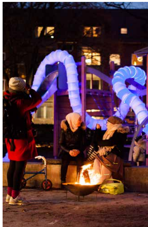
Områdefornyelse: Midlertidig lysinstallation