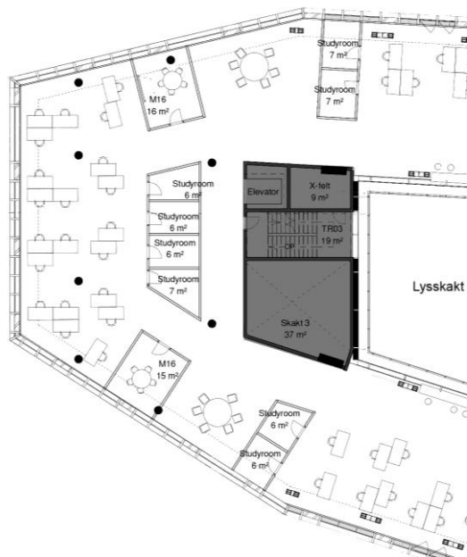
Figur 2A. Udsnit af 2. sal af det bearbejdede projekt med markering af kerne til teknik og adgangsforhold (ca. 90 m 2 pr. etage). C F Møller