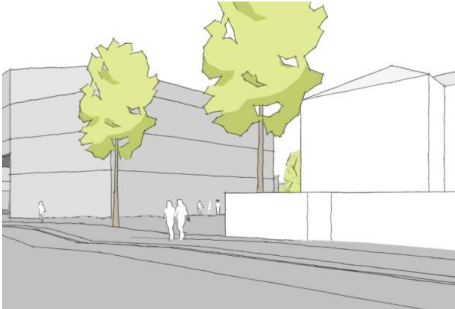
Figur 3A. Lokalplanforslaget, illustration af domicilet og villaen vest for, set fra Valby Långade. C F Møller