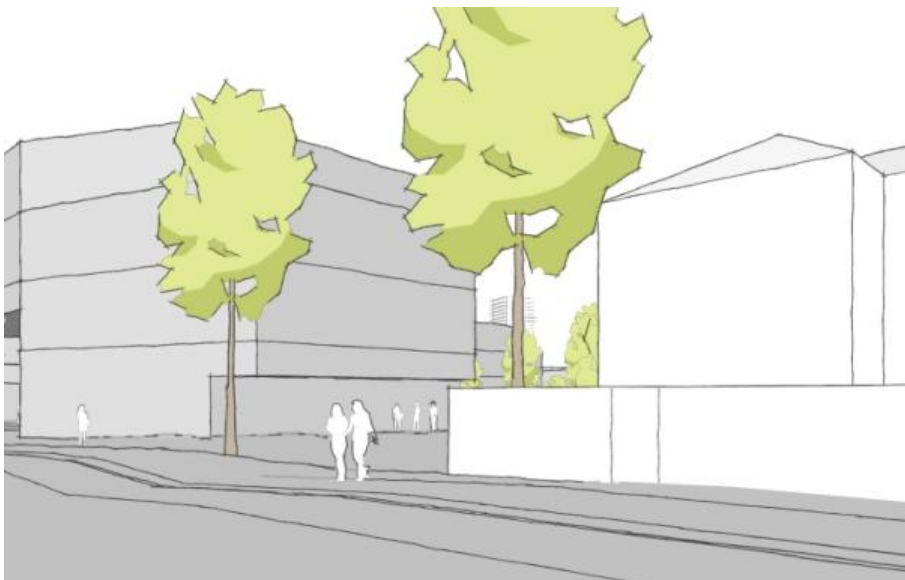
Figur 3B. Det bearbejdede projekt, illustration af domicilet og villaen vest for, set fra Valby Långade. C F Møller