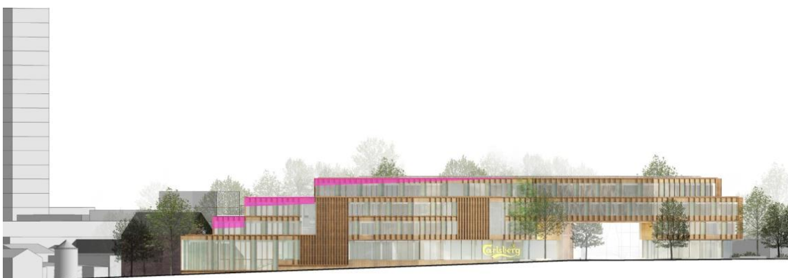
Figur 1B. Det bearbejdede projekts facade mod Valby Langgade med markering af, hvor de maksimale facadehøjder overskrides, hvis højden måles i forhold til Valby Langgades terræn og ikke i forhold til koten ved Gamle Carlsberg Vej (+27.5). C F Møller + Center for Byplanlægning