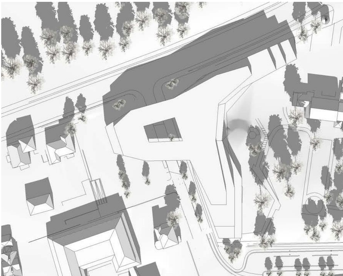
Figur 1A. Det bearbejdede projekt med skygger. C F Møller