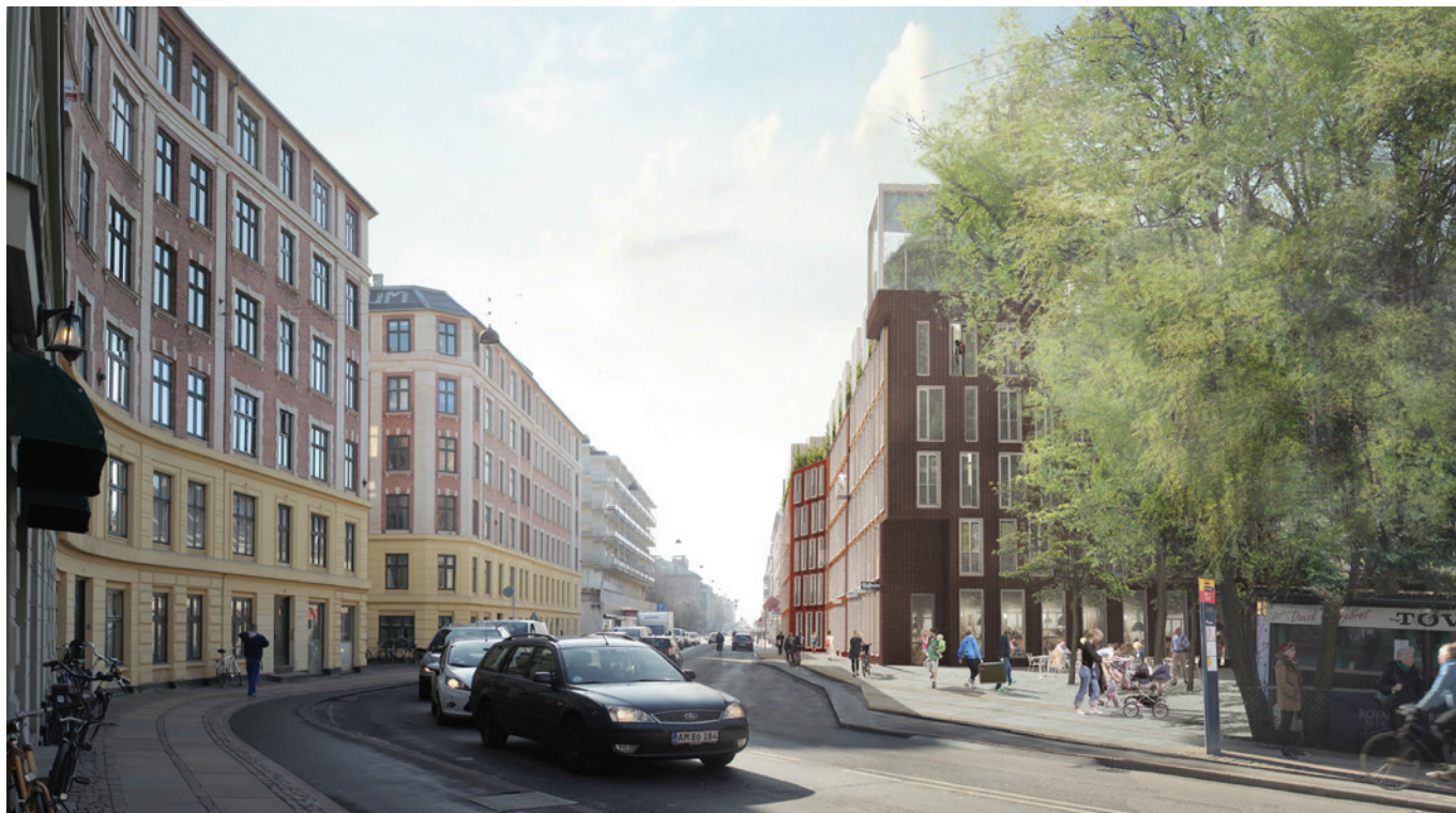
Illustration, der viser forslag til udformning af bebyggelsen set fra Enghavevej. Bebyggelsen foreslås udført i 5 etager + udnyttet tagetage med tilbagetrukne facader og store karnapper i let konstruktion. Facaderne er opdelt i byhuse med en variation af tegl, vinduesformater mv. med reference til nabobygningerne. På hjørnet mod Enghavevej foreslås en hjørnemarkering i 6. etage. (Illustration Entasis)

anlæg af kombineret cykelsti og cykelbane i forbindelse med anlæg af ny asfalt på Enghavevej i sommeren 2015. Den første del af strækningen ud for nr. 12-14 anlægges som cykelbane af hensyn til at muliggøre en senere omdannelse til cykelsti på det udvidede vejudlæg, som plansagen vil muliggøre.