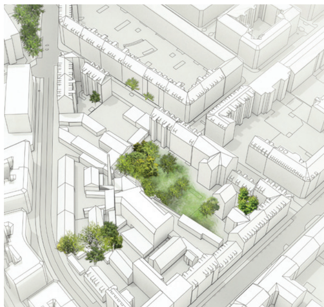
Volumenmodel, der viser de eksisterende forhold (Illustration Entasis)

Carlsberg, hvor der sker byudvikling af et nyt integreret byområde, grænser op til kvarteret. I Enghaveparken er der igangværende planer om transformation af parken med skybrudssikring mv. På Enghavevej 12-30 planlægges