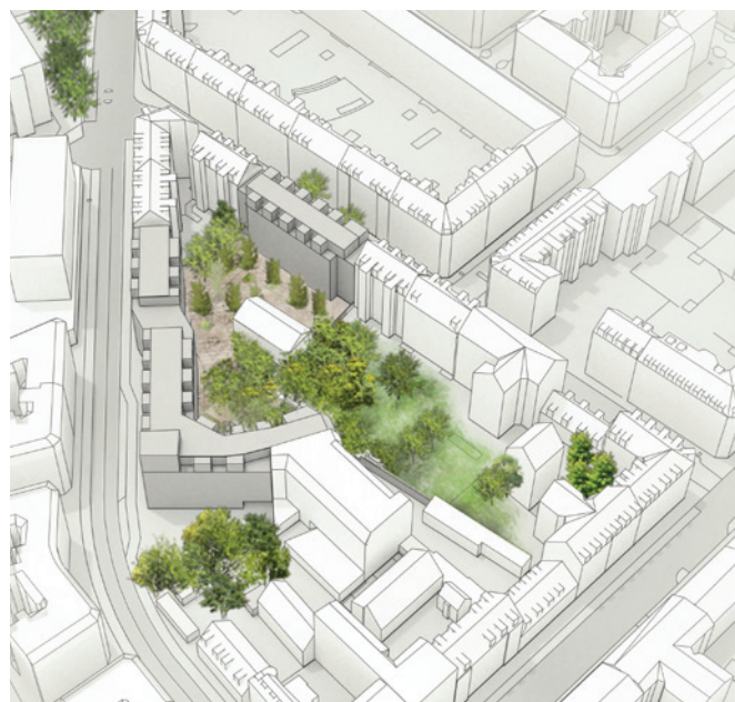
Volumenmodel, der viser princip for indpasning af ny randbebyggelse i karréen. Projektforslaget muliggør et udvidet vejudlæg på Enghavevej og en åbning af karréen ud for Rytmask Center. (Illustration Entasis)