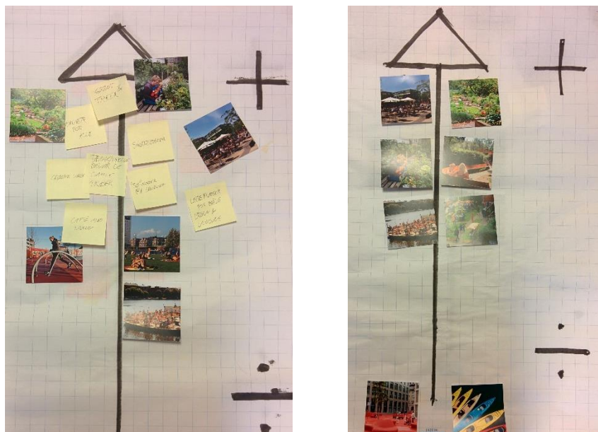
Eksempler på prioriteringsplaner fra workshoppen om byliv.