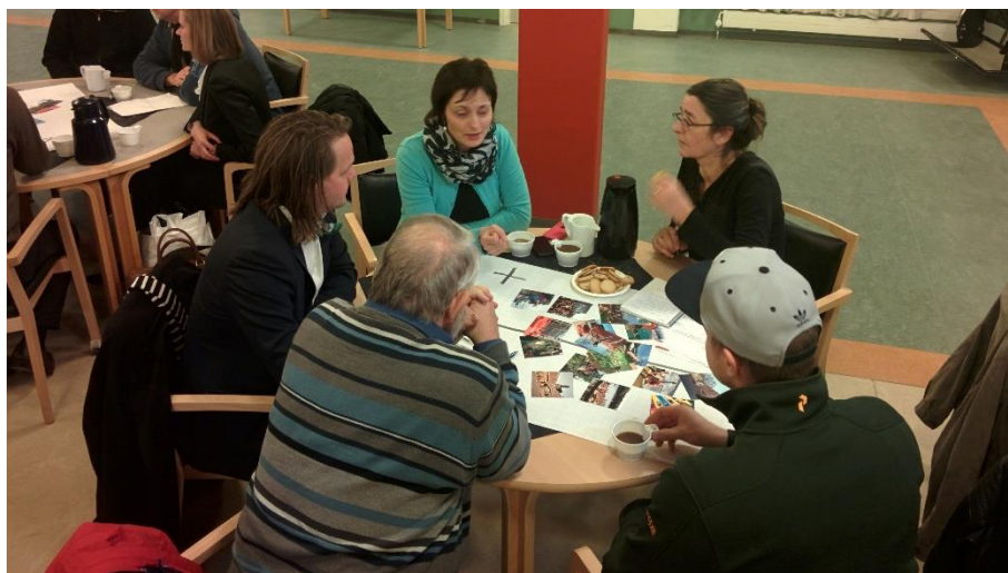
Ved hjælp af prioriteringsplancher blev grupperne bedt om at diskutere og prioritere forskellige muligheder for byliv på grunden i forbindelse med Fremtidens Sølund.