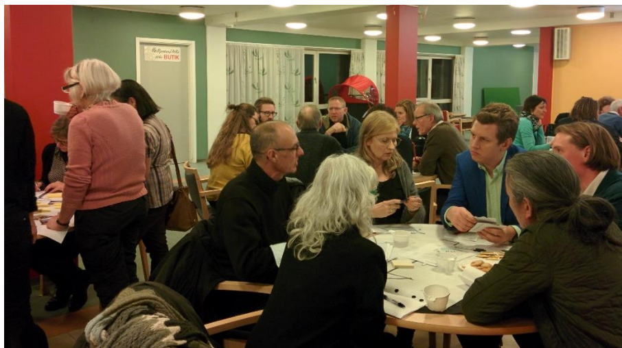
Workshoparbejde i grupper fra første borgerinddragelsesmøde.