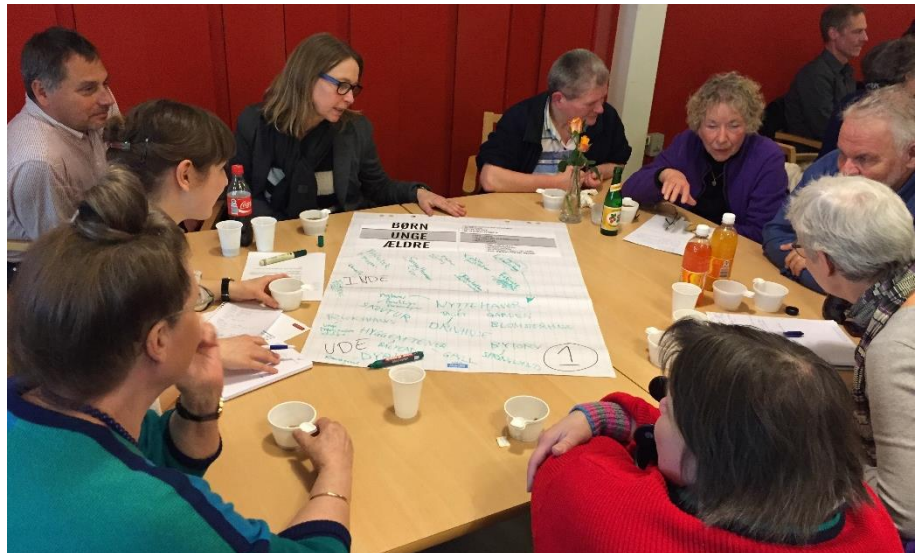
I grupper diskuterede deltagerne muligheder for fællesskaber og fælles møderum på tværs af de tre brugergrupper: børn, unge og plejecentrets beboere.