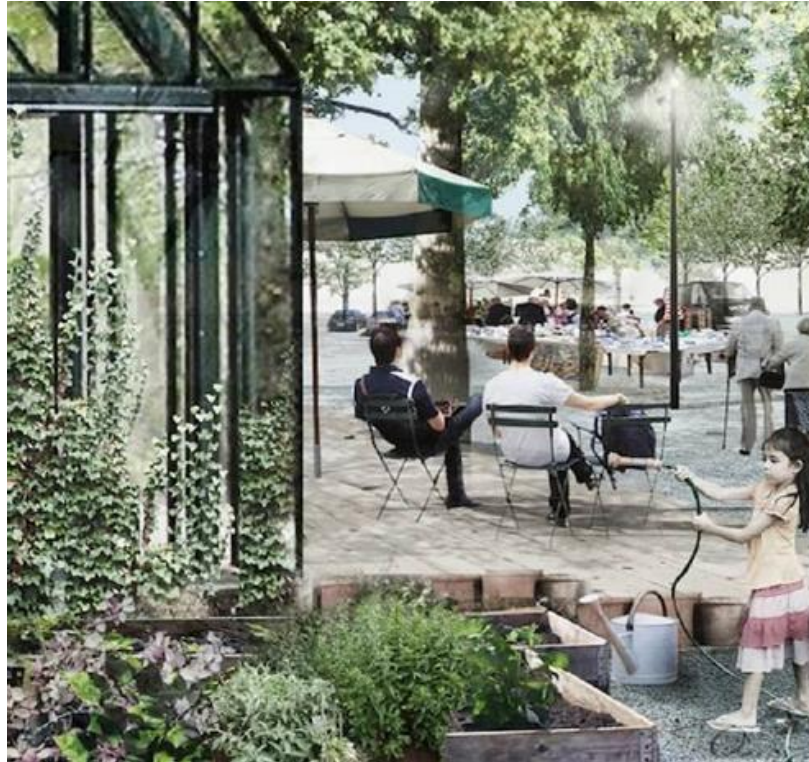
Illustration fra forslag til Fremtidens Sølund, indsendt via hjemmesiden.