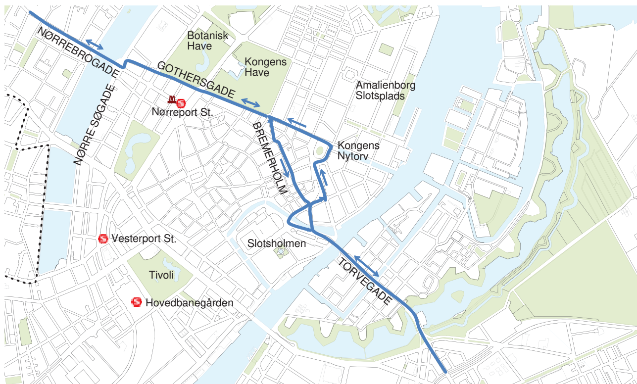
Forslag til letbane-linjeføring gennem Indre By