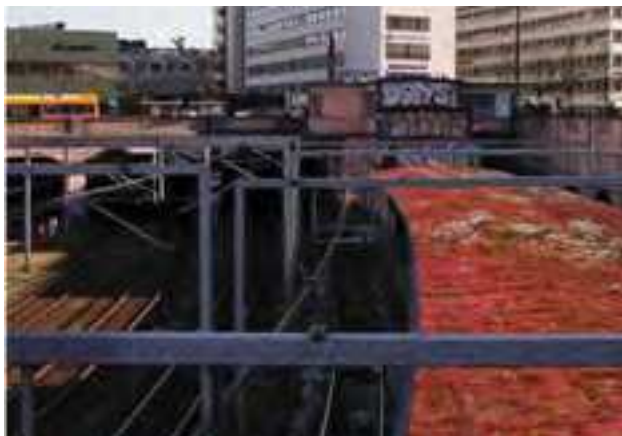
På billedet ses en animation af Vesterport Station med grønt tag.