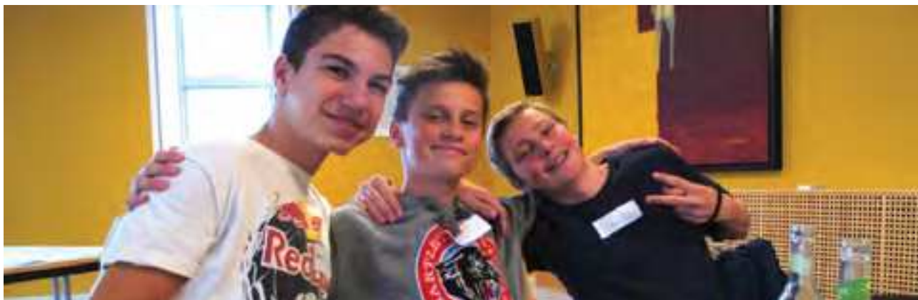
Indre By Lokaludvalg