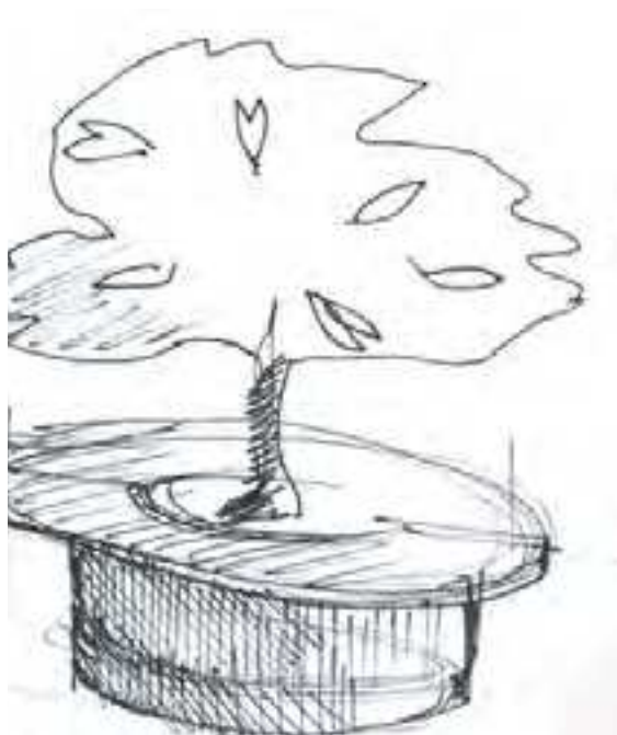
En skitsetegning af mobile træer version 2

Andre udfordringer har været bydelens kompakthed, hvor der skal tages hensyn til mange funktioner. Smalle fortove, cykelstativer og adgang for varevogne er nogle af de forhindringer, der besindigt skal med i planlægningen af flere mobile træer i bybillede, og er en udmærket afspejling af de daglige udfordringer, som bydelen møder.