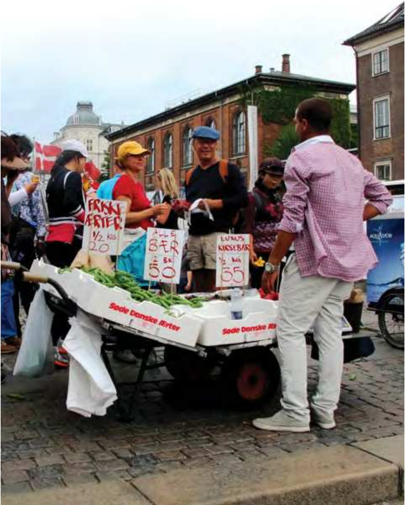
Indre By Lokaludvalg