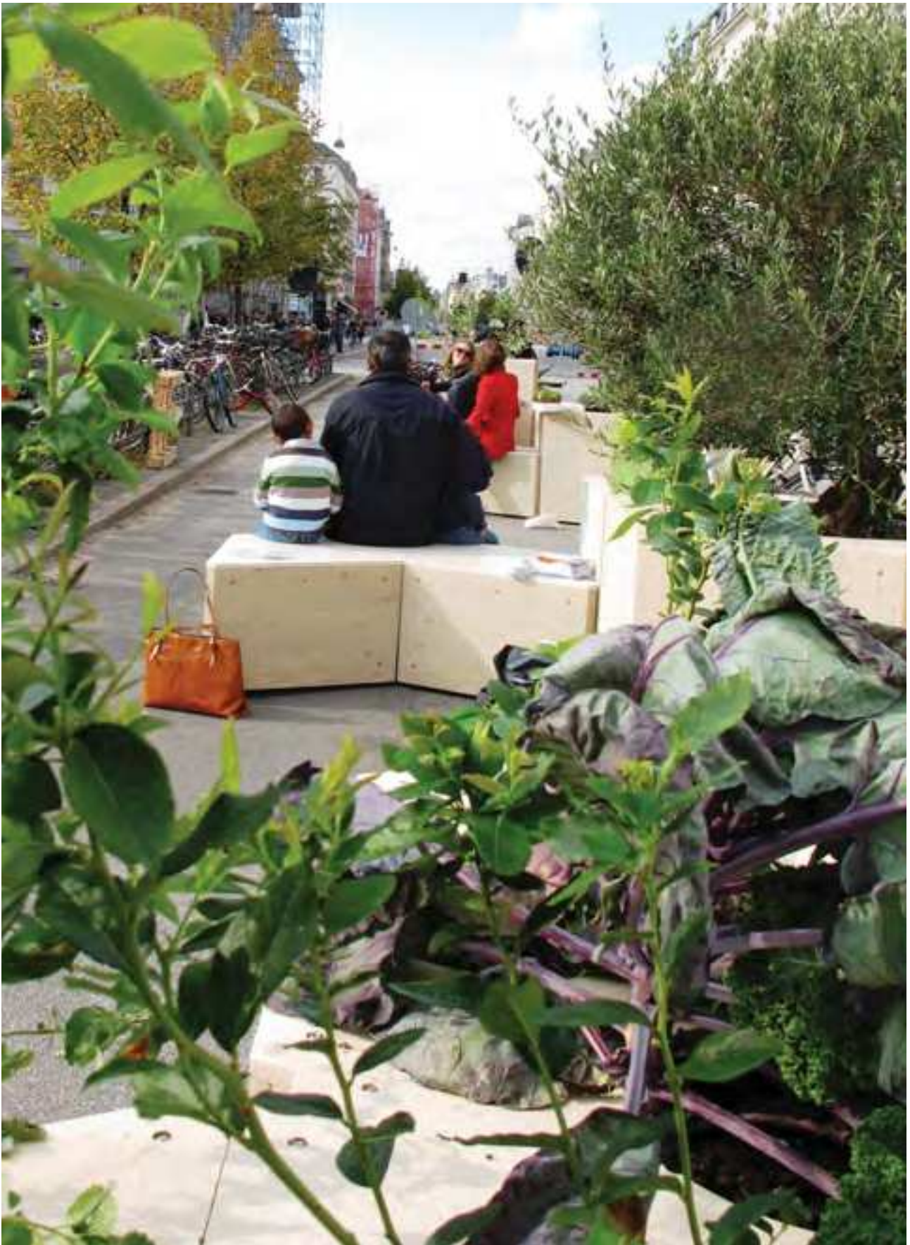
Indre By Lokaludvalg