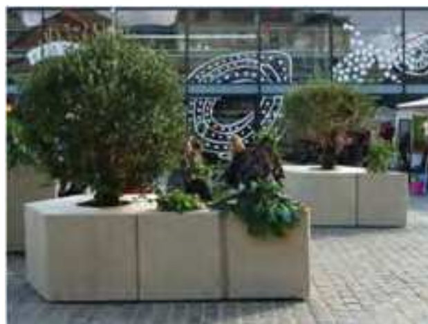
Miljøpunktets eksisterende mobile træer.

Bund laves af rør, f.eks. af isolationsrør, der bruges i industrien og til undergrunden. Heri kan stilles laurbærtræ eller buskbom og andet stedsegrønt. Træpladerne samles af to dele og låser konstruktionen, og træerne kan ikke flyttes. Det gør dem nemme at opstille og besværliggør tyveri.