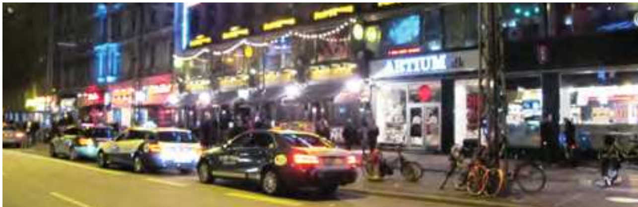
Indre By Lokaludvalg