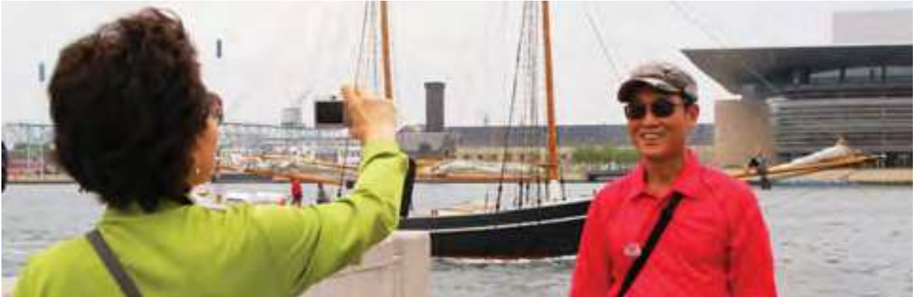
Indre By Lokaludvalg