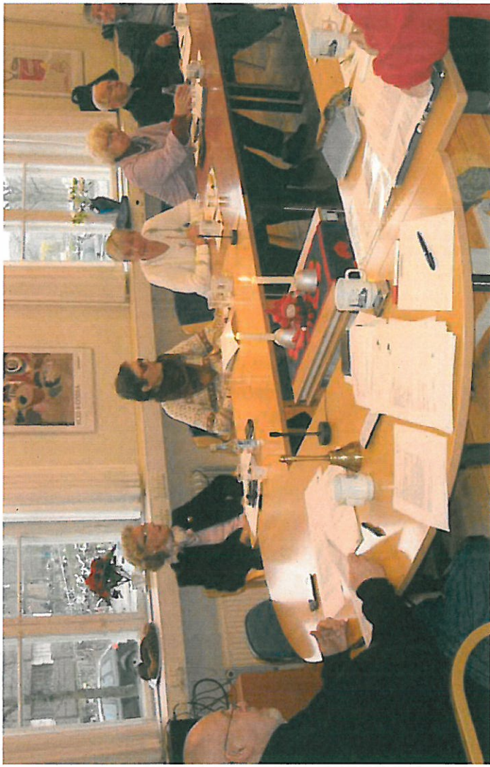
Møde i Regionsudvalget i ældrerådets mødelokale den 24. november 2011.

Regionsudvalget består af én repræsentant fra hvert ældreråd, de 2 medlemmer af Danske Ældreråds bestyrelse, samt Københavns repræsentant i Regionsrådets forretningsudvalg. Til udvalgets møder inviteres, uden stemmeret, Frederiksberg Ældreråds medlem af Regionsældrerådets forretningsudvalg og øvrige repræsentanter i Regionsældrerådet.