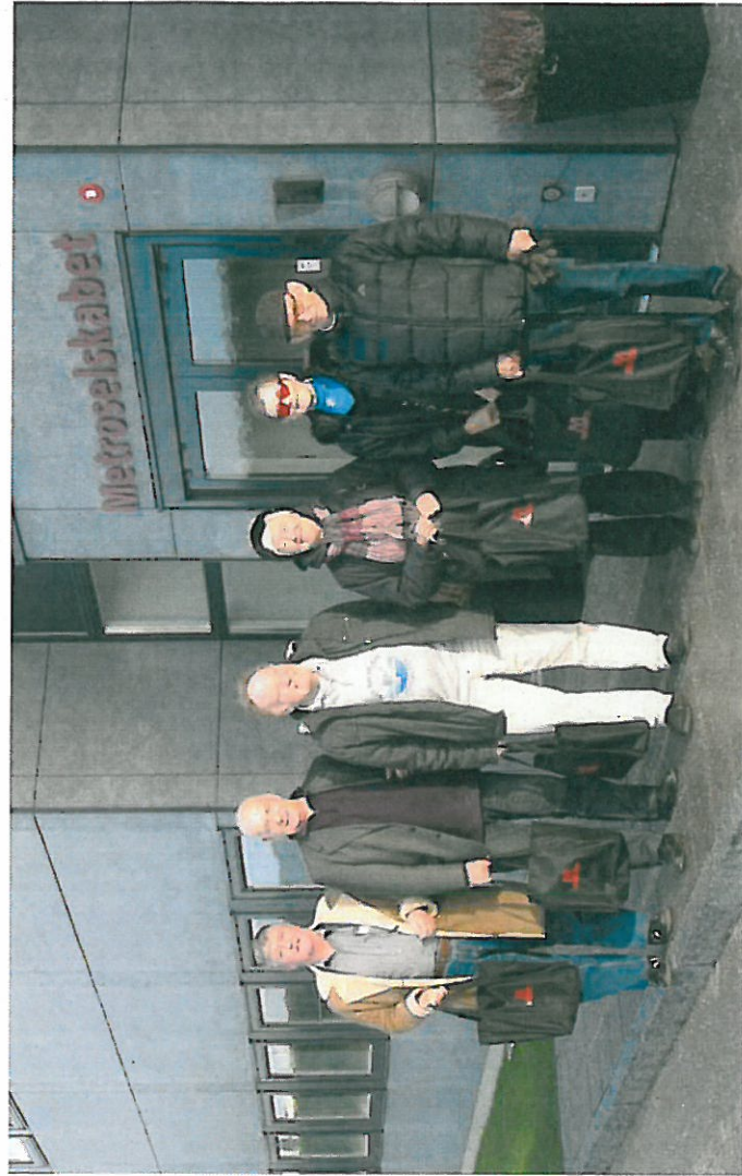
Møde med Metroselskabet den 8. december 2011.

Mange forskellige forhold af trafikal art, i særdeleshed vedr. tilgængelighed i bred forstand, har været berørt i udvalget, der som en af de store sager i året har haft udarbejdelse af et høringsvar i sagen om en fodgængerstrategi for København.