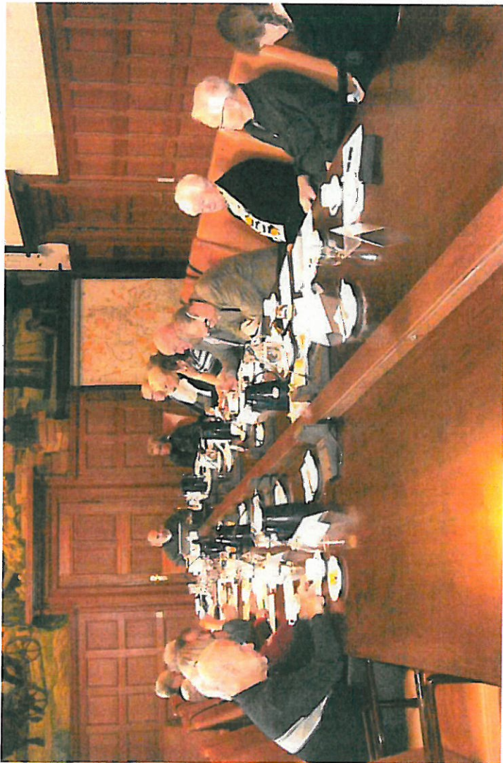
Det afsluttende årsmøde i Formandsgruppen den 15. december 2011 på Rådhuset.