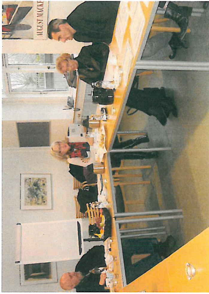
Forretningsudvalgets møde med Borgerservice den 23. november 2011.