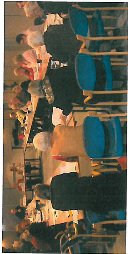
Fra Formandsgruppens seminar på hotel Frederik d. II i Slagelse den 17. og 18. november 2011.