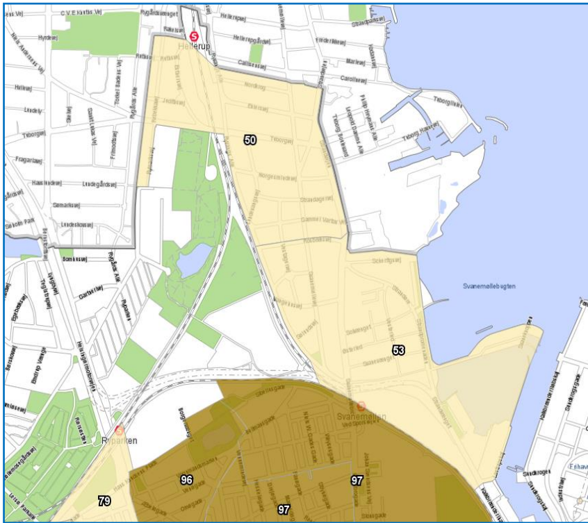
Kort # 2 viser belægningsprocenterne kl. 22