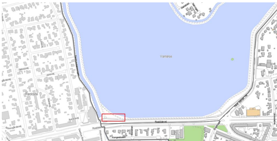
Billede 2: Den røde firkant markerer det område, der kan beplantes, så der dannes et nyt byrum og afskærmning ud mod Roskildevej.