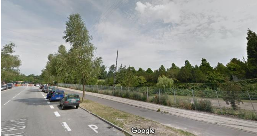
Billede 3: Foto af Sjælør Boulevards nordlige ende