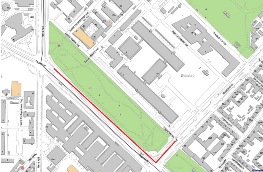
Billede 5: Markering på kort af det område, hvor beplantningen kan suppleres for bedre afskærmning af Amorparken.