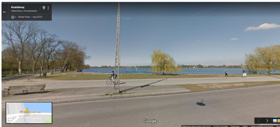
Billede 1: Foto af Damhussøen set fra det sydvestlige hjørne.