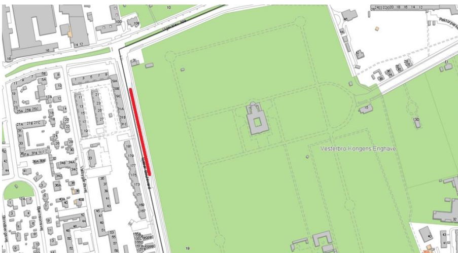
Billede 4: Den røde streg markerer det område langs kirkegården, hvor der foreslås yderligere beplantning for at afskærme kirkegården ud mod Sjælør Boulevard.