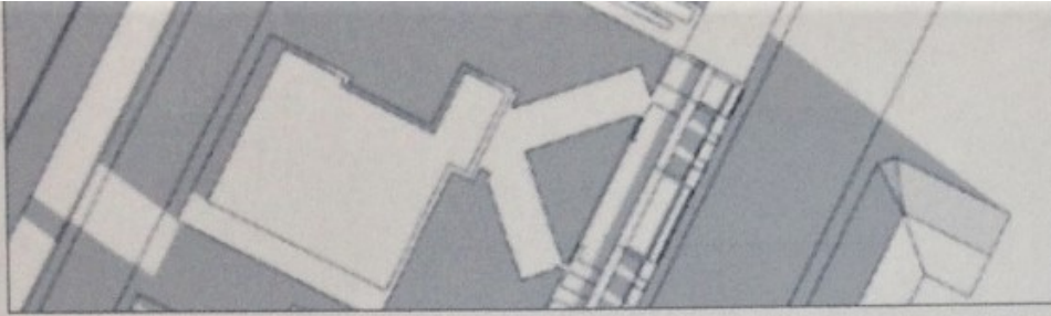
21. marts kl. 9.00