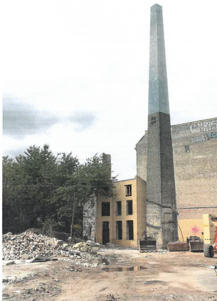
- Illustration: genopførelse af nedrevet del af skorsten.