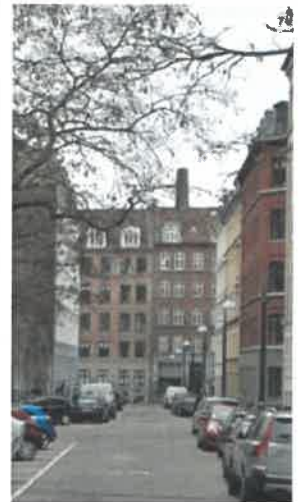
- skorstenen synlig fra hhv. Haderlevsgades, Enghave Plads og Tøndergade