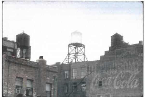
- værket er inspireret af Rachel Whitereads ikoniske og signaturskabende vandtårn i New York