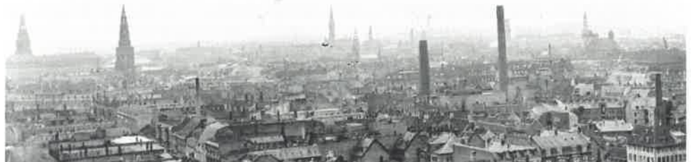
- fra dengang hvor kirkespir og industriskorstene i fællesskab udgjorde byens horisont