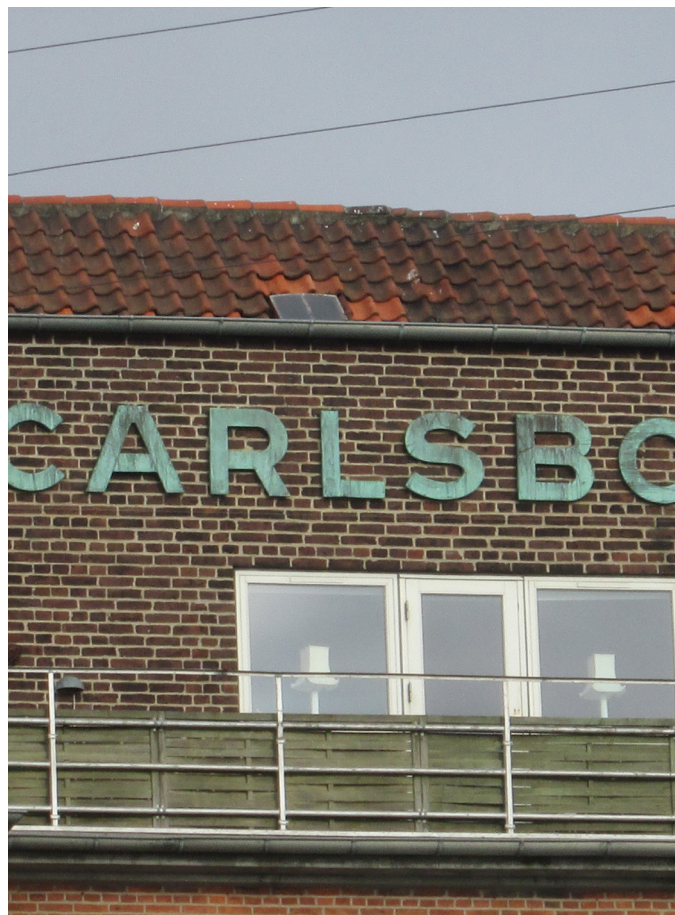
Udsnit med tag