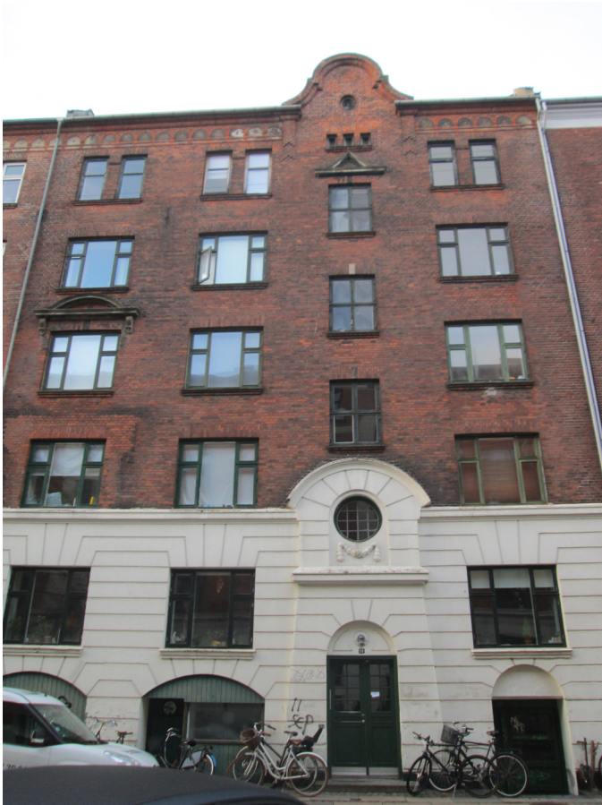
Facade mod Esbern Snares Gade