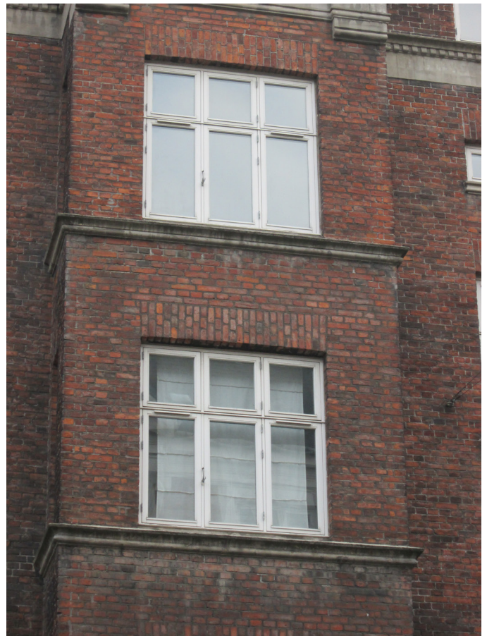
Udsnit med vinduer