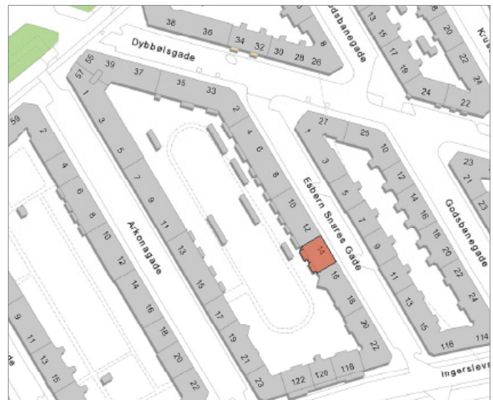
Ejendommen ligger i bydelen Vesterbro / Kgs. Enghave