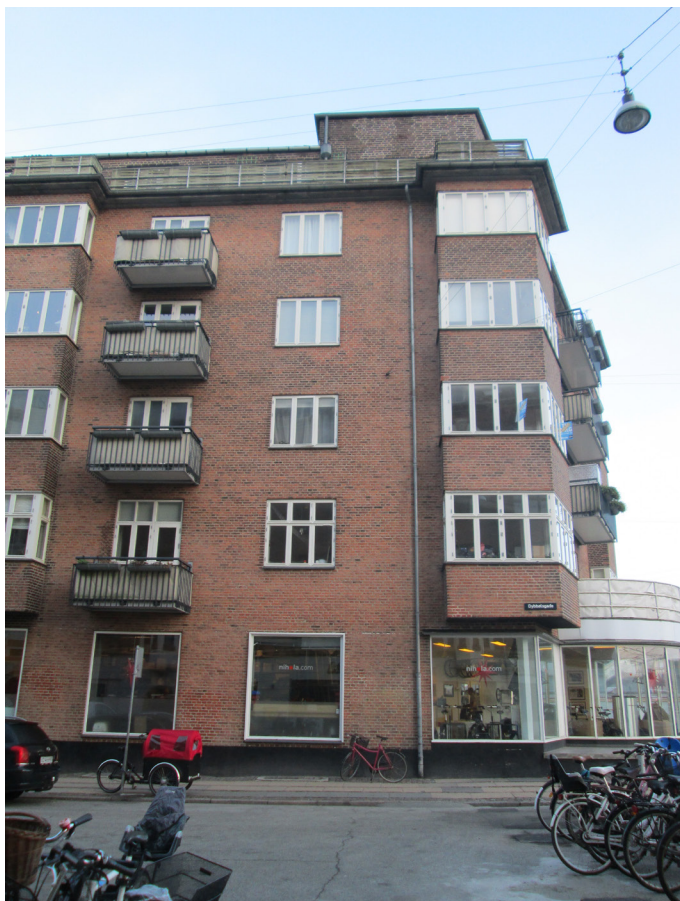
Facade mod Dybbølsgade