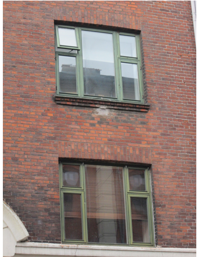
Udsnit med vinduer