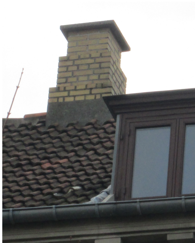
Udsnit tag og kvist