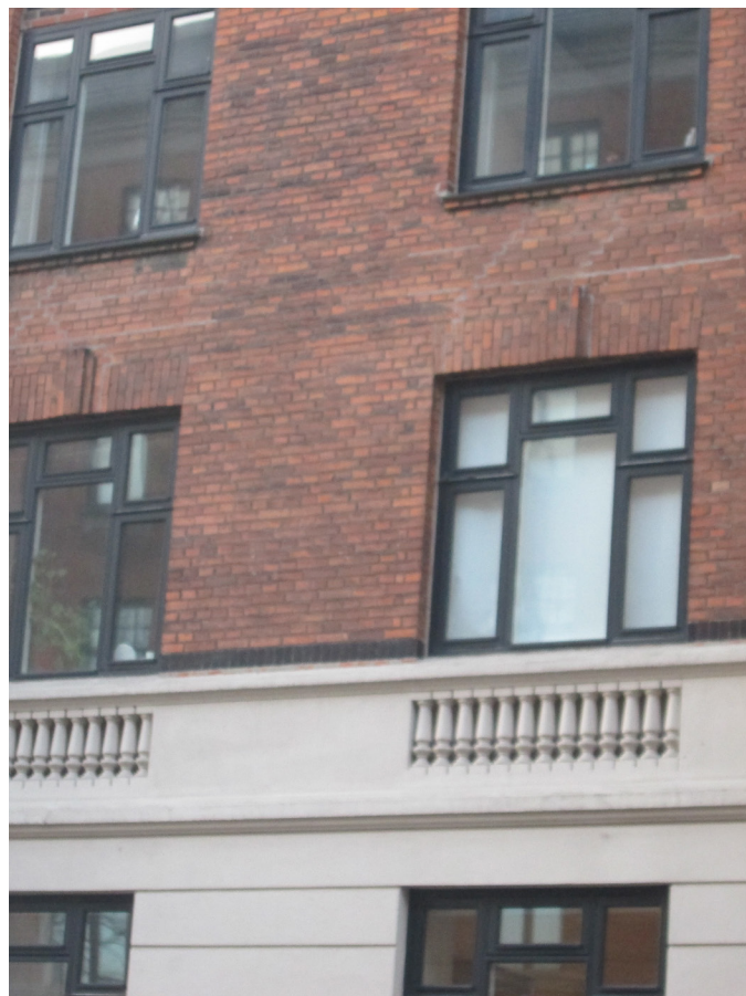
Udsnit med vinduer