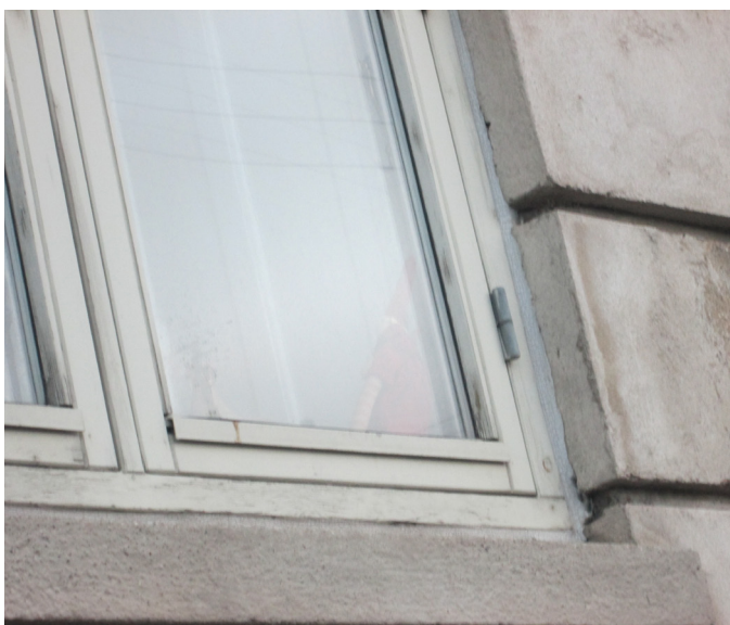
Udsnit gammelt termovindue