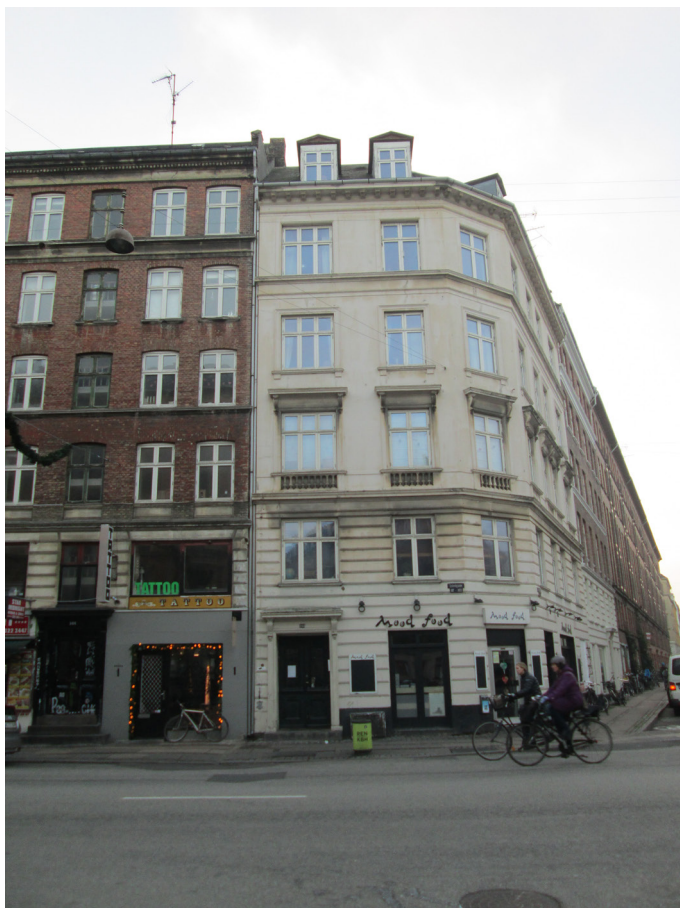
Facade mod Istedgade