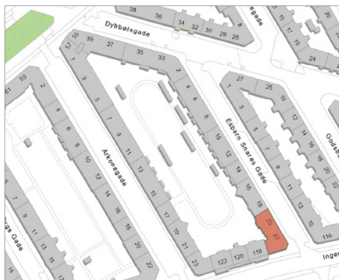
Ejendommen ligger i bydelen Vesterbro / Kgs. Enghave