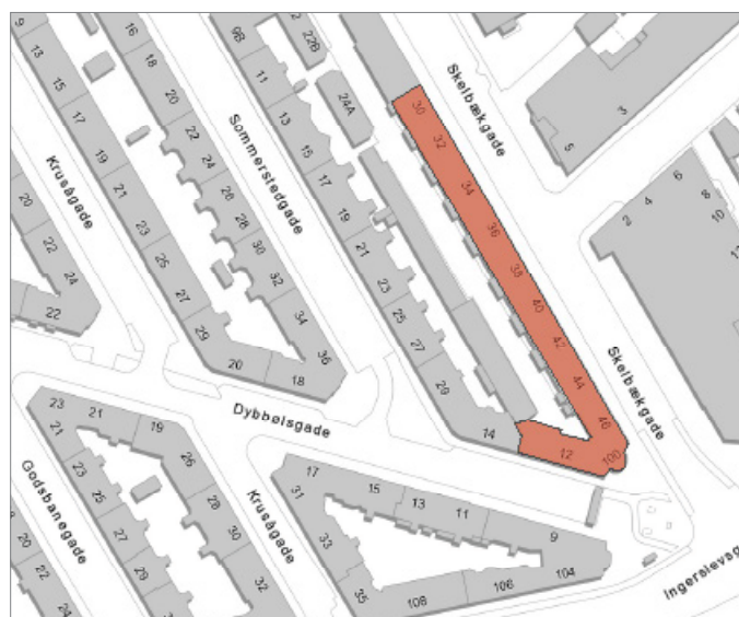
Ejendommen ligger i bydelen Vesterbro / Kgs. Enghave