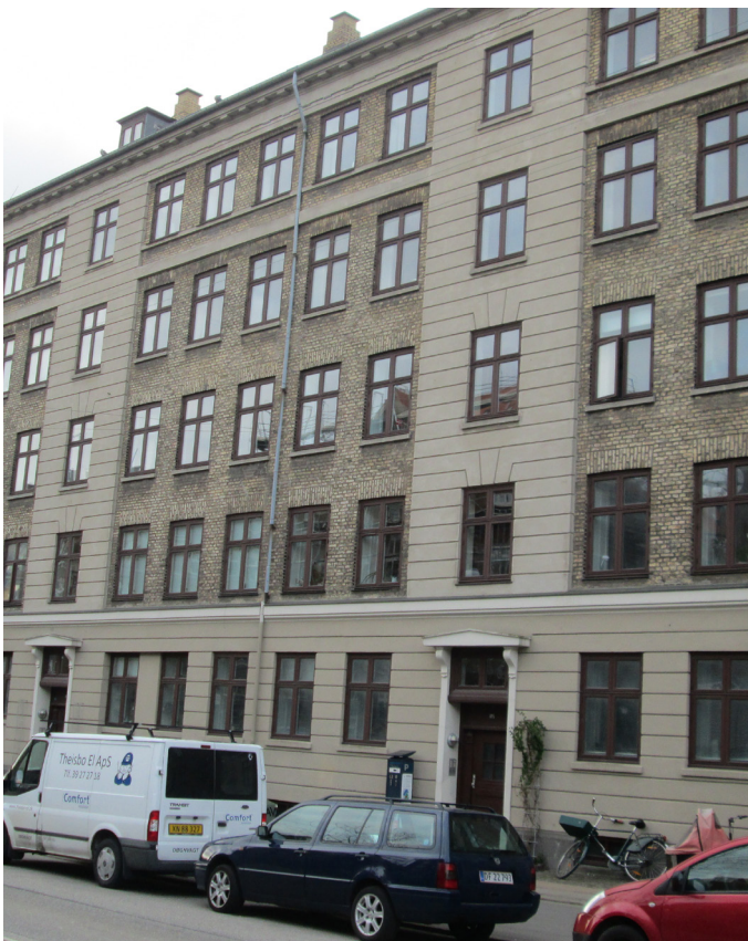
Facade mod Sønder Boulevard