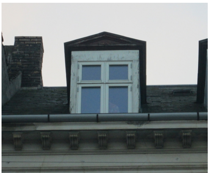
Kvist og udsnit af tag