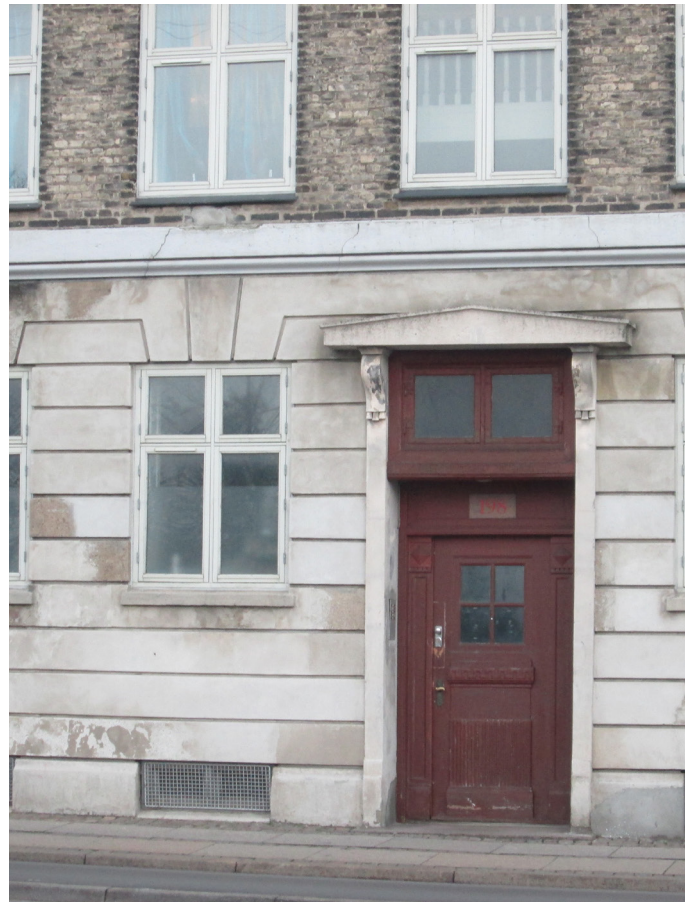
Udsnit med gadedør og vinduer