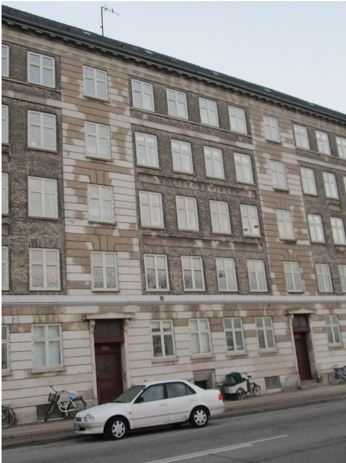
Facade mod Ingerslevgade og Esbern Snares Gade