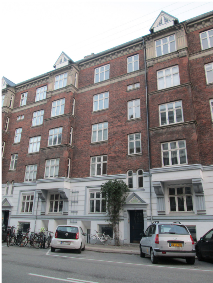
Facade mod Ingerslevgade og Esbern Snares Gade