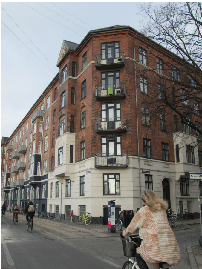
Facade mod Ingerslevsgade og Esbern Snares Gade