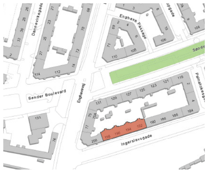
Ejendommen ligger i bydelen Vesterbro / Kgs. Enghave