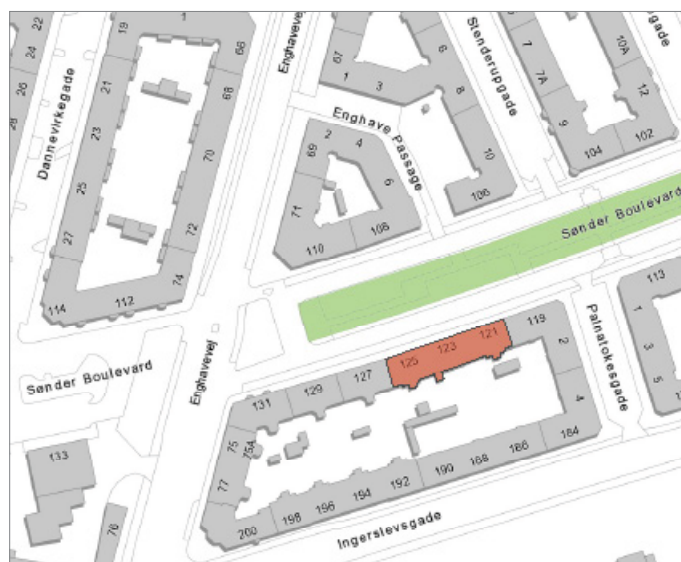
Ejendommen ligger i bydelen Vesterbro / Kgs. Enghave