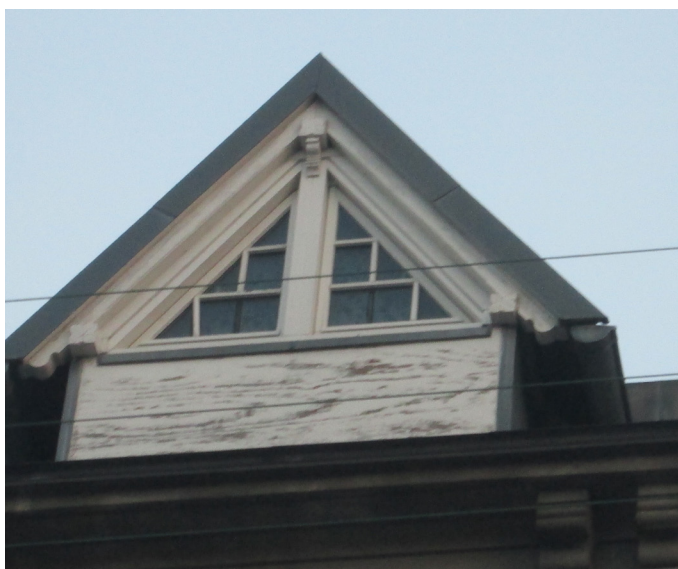
Udsnit vindue karnap