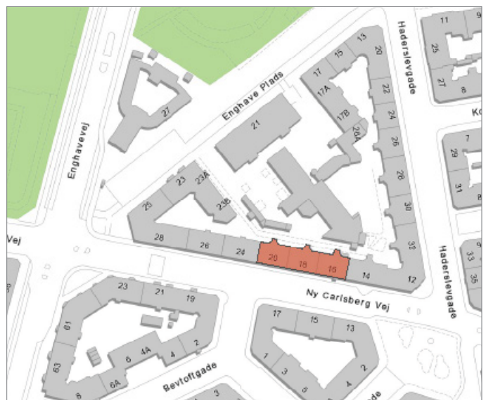
Ejendommen ligger i bydelen Vesterbro / Kgs. Enghave