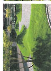
Naturoplevelser og ophold