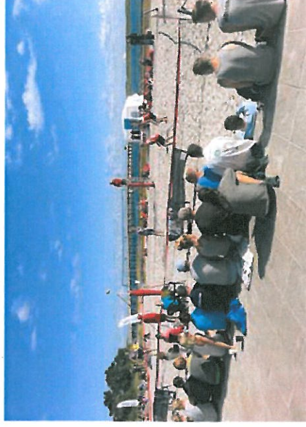
Beachvolleybane / Beach tennis bane med siddekant

Størrelse: 4 x 8 m. Belægning: Rødt asfalt Beskrivelse: Gyngestativ med 2 mandsgynger Stålgynger Referenceprojekt: Den røde plads