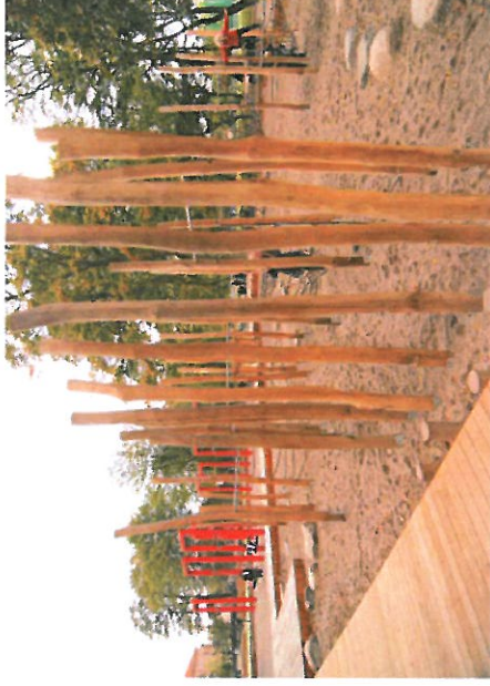
Lege og klatreskov

Størrelse: 17 x 17 m. Belægning: Sand og træbelægning Beskrivelse: Træstammer Stålrammer Stål og betonfunderet Net af klatretov