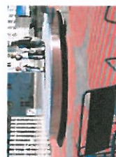
Interaktivt inventar til sociale ophold og møder