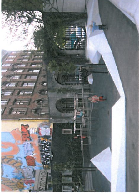
Legelandskab, boldbane og løbehjulsbane på kanter

Størrelse: 50 x 27 m. Belægning: Asfalt Beskrivelse: Aktivitetsplads Stålstativ Hvid beton skate landskab Stål mål