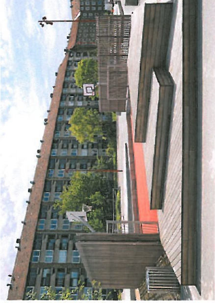
Sænket boldbane med ophold

Størrelse: 20 x 12 m. Belægning: Sand, græs og træ Beskrivelse: Åbent klatremiljø Stålrammer Gummimåtter Net af jernwire Referenceprojekt: Amsterdam, Holland