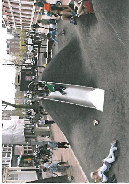
Legge- og opholdsbakker (lille)

Størrelse: 35 x 20 m. Belægning: Græs Beskrivelse: Overdækket scene Alu skellet Pressenning Halmballer Referenceprojekt: Enhave park - midlertidig scene