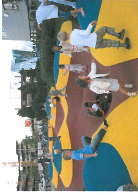
Lege- og opholdsbakker (Stor)

Størrelse: 20 x 18 m. Belægning: Faldgummi Beskrivelse: Lege bakker og huller Opbygning af gummimåtter, jord og asfalt Belagt med faldgummi