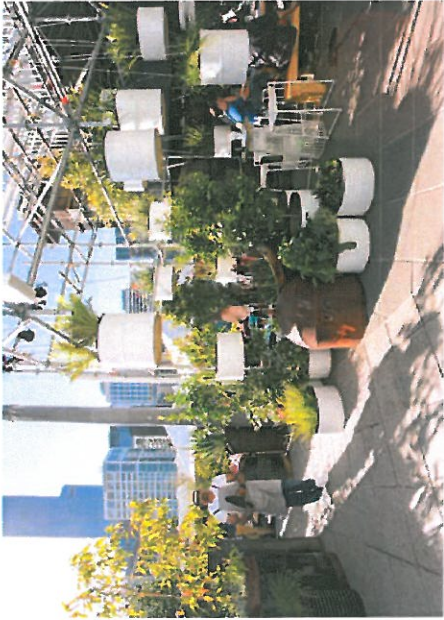
Plante-Pavillion - nyttehave

Størrelse: 17 x 8 m. Belægning: Hård belægning, fliser Beskrivelse: Tæt grøn pavillion Ståltønder til planter Jernwire til ophængning Løs møblering Aluminium stillads