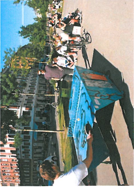
Bordtennis, bordfodbold og opholdskant

Størrelse: 10 x 6 m. Borde 2.5 x 1.5 m Belægning: Hård belægning. Beskrivelse: Åbent miljø Bordtennisborde af stål Siddekanter af beton Referenceprojekt: Sønder Boulevard