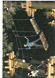
Leg- og bevægelses faciliteter