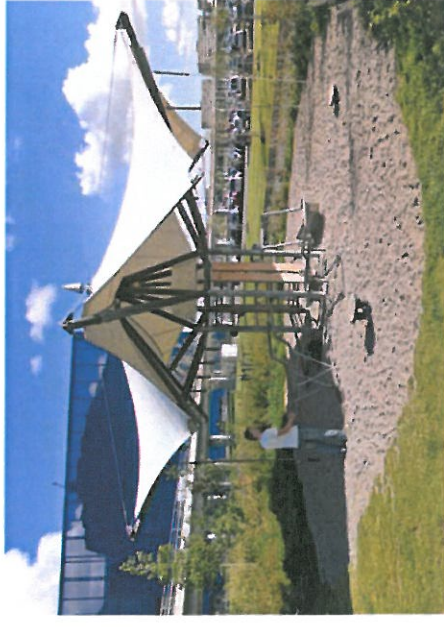
Træningsstation med sejl

Størrelse: 12 x 12 m. Belægning: Sand Beskrivelse: Solsejl Stål skellet Tov til gyngende Wire opspænding Inventar af træ