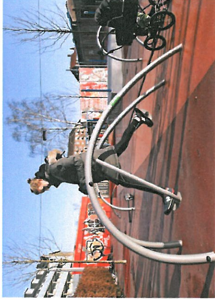
Fitness maskiner (lille)

Referenceprojekt: Søerne, Charlotte Ammundsens plads