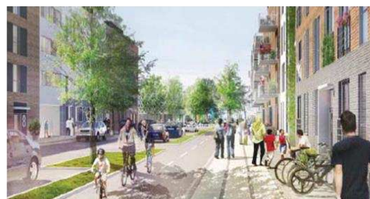
Fremtidig boliggade hvor facadeforløbet fremstår meget varieret for at nedbryde den ensartede bebyggelse og skabe bedre proportioner.