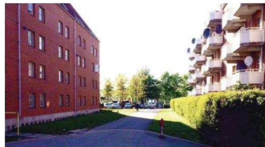
Eksisterende brandvej som omdannes til boliggade.