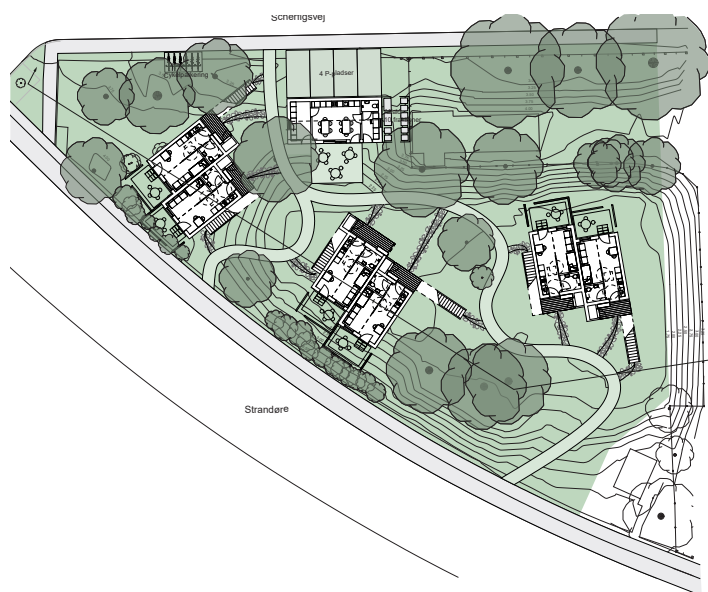
Situationsplan - placering på grunden