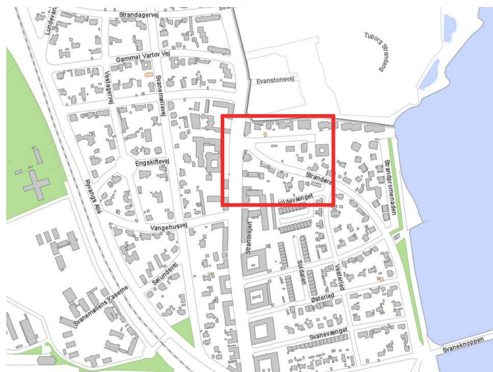
Placering i byen