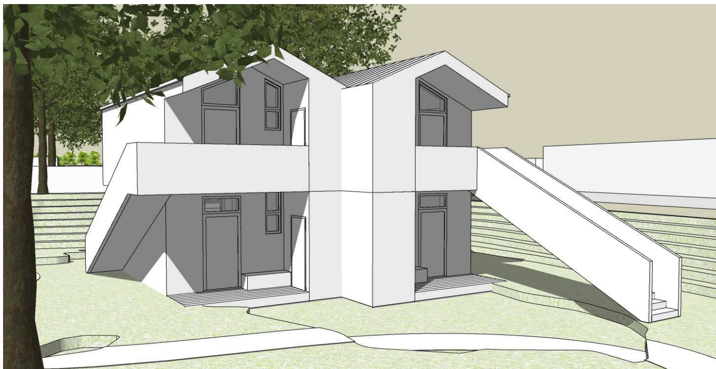
Visualisering af klynge i to etager