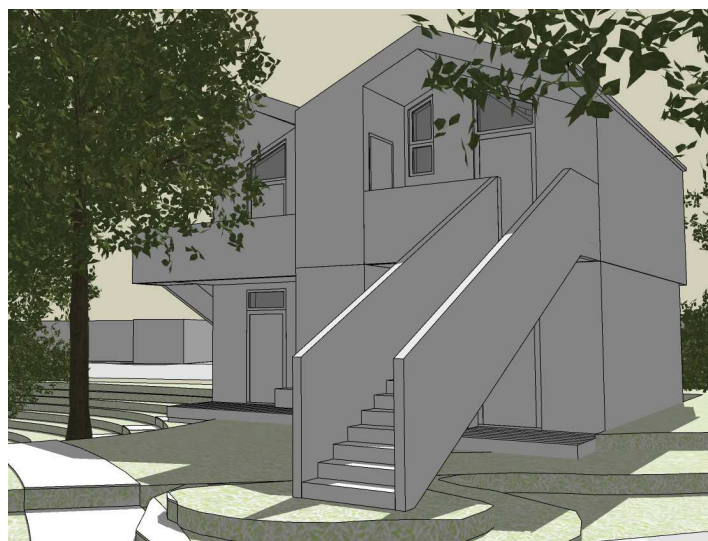
Scherfigsvej - Skæve boliger

Boligerne der skal huse hjemløse, udlægges som 12 små boliger og 1 fælleshus. Boligerne placeres i klynger af 4 boliger - 2 i stueplan og 2 på 1. sal. Boligklyngerne indpasses imellem de eksisterende træer på grunden og fordeles så, der er god plads omkring hver enkelt klynge. Placeringen af klyngerne følger landskabet og boligerne kommer til at opleves som fritliggende bygninger i en grøn oase. Fælleshuset placeres solitært nærmest Scherfigsvej. Alle boligerne og fælleshuset bindes sammen af en sti, der løber igennem området.