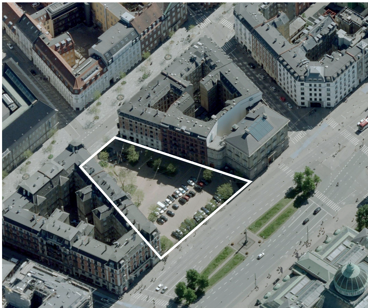
Dantes Plads set mod øst, med det aktuelle område indtegnet med hvid linje.

Q-park vandt i foråret 2018 Københavns Kommunes udbud om salg af Dantes Plads og erhvervede derved retten til at etablere et underjordisk parkeringsanlæg, samt pligten til at nyindrette selve pladsen med udgangspunkt i det eksisterende; men uden parkeringspladser på terræn. Parkeringsanlægget vil være privat og ejes samt driftes af Q-park, hvorimod pladsen har status af offentlig vej og overdrages til drift af Københavns Kommune.