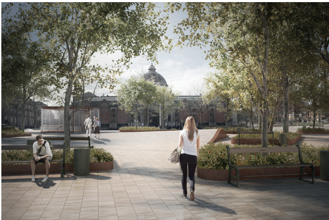
VISUALISERING DANTES PLADS - KIG MOD GLYPTOTEKET

Den største ændring på pladsen er rampeanlægget mod Vester Voldgade. Det vil blive omkranset af en kantning i cortenstål påmonteret et enkelt værn i samme materiale. Et design, der underordner sig den materialemæssige holdning på stedet. For at minimere rampeanlæggets fremtræden løftes belægningen i en ny bølge over nedkørslen til p-kælderens. En bølge, der taler sammen med de oprindelige bølger på pladsen. Selve ramperne, der bevæger sig ned i konstruktionen vil være af beton.