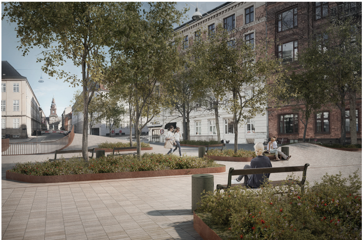
VISUALISERING AF DANTES PLADS - KIG NED MOD CHRISTIANSBORG

Nøddgangstrappen lægges diskret ind i et plantebed og den omkranses af det samme værn som ved rampeanlægget.