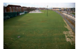
Forslag til placering af kunstgræs-fodboldbane, boldbaner samt klubhus

Den nordlige del af folkeparken med kunstgræsbanen rummer ca. 18.360m 2 af de i alt ca. 48.340m 2 aktivitetspark.