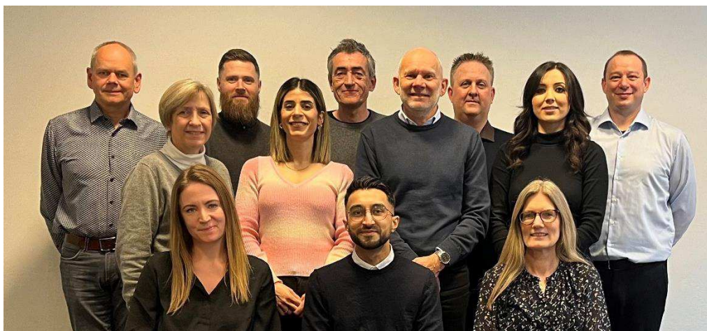
Intern Revision, Finansielt Team og Team Særlige Undersøgelser